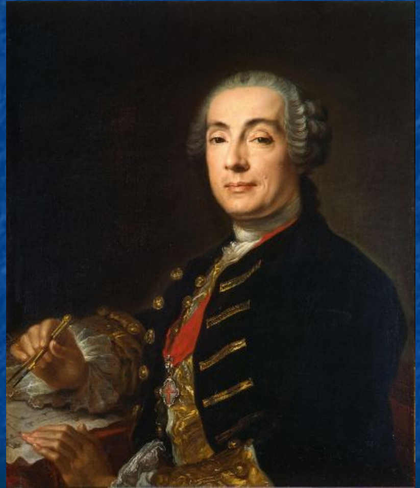
Франческо Бартоломео Растрелли