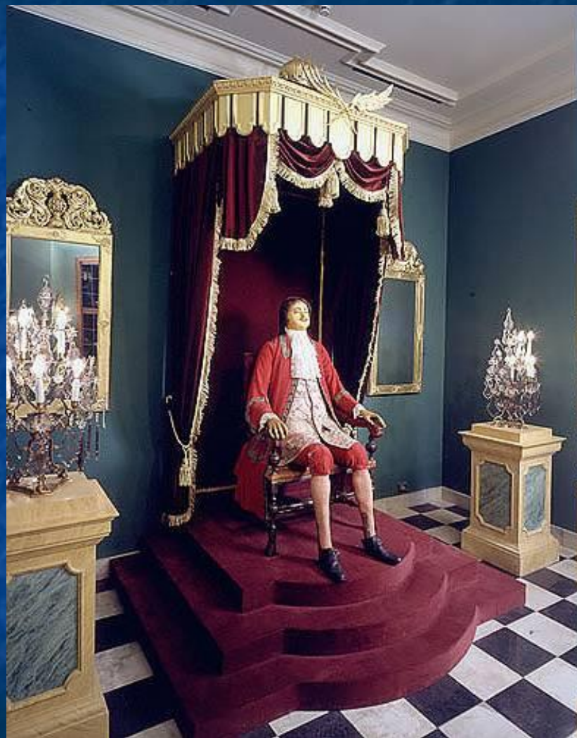
Восковая фигура Петра I