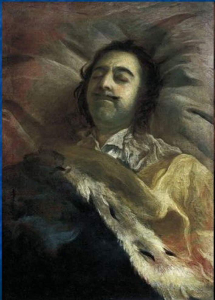
«Пётр Первый на смертном ложе»