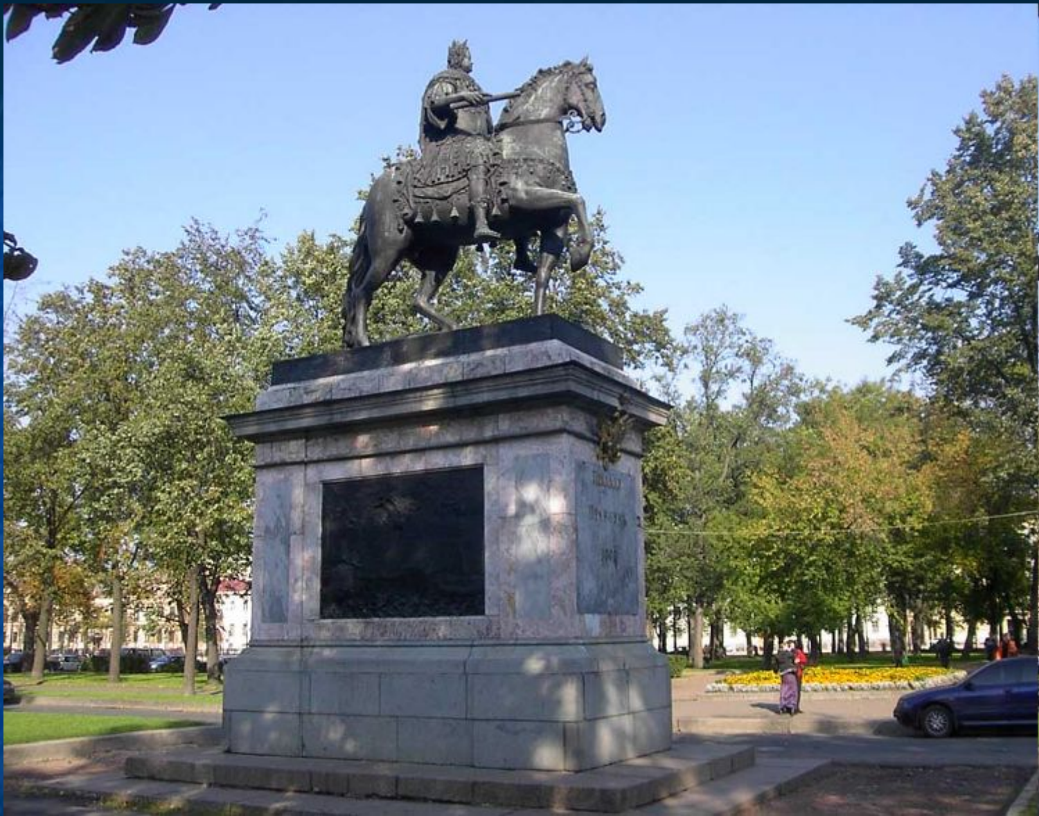
Памятник Петру I