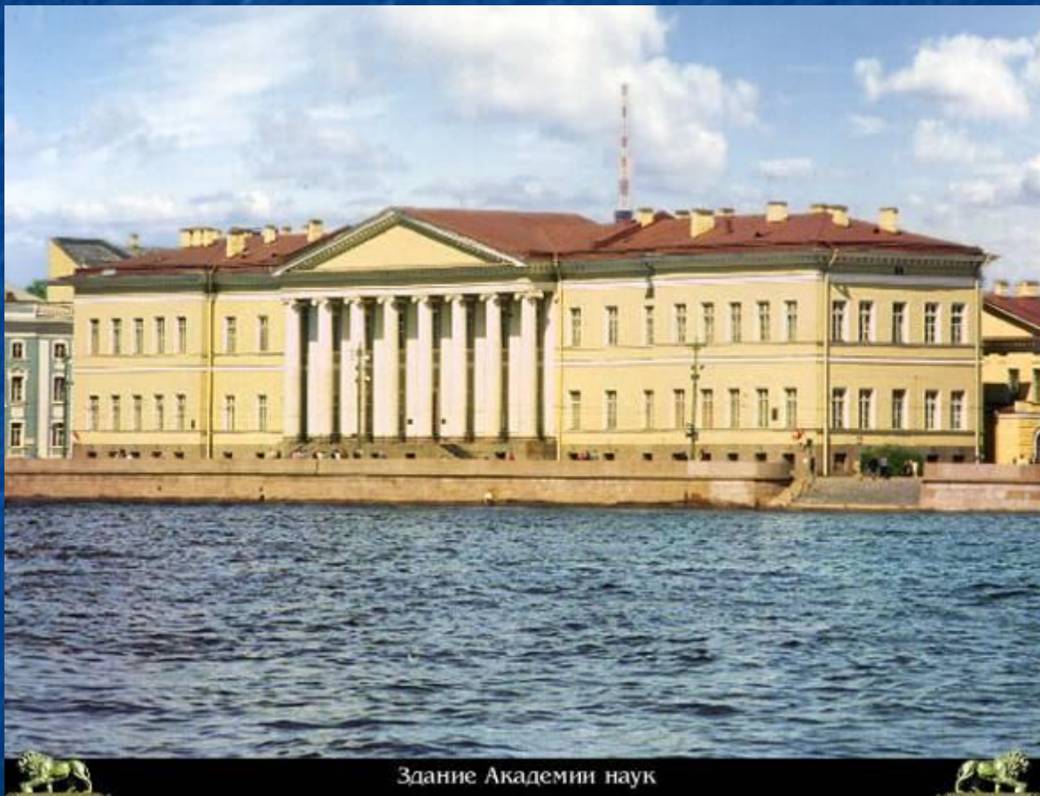
Здание Академии наук