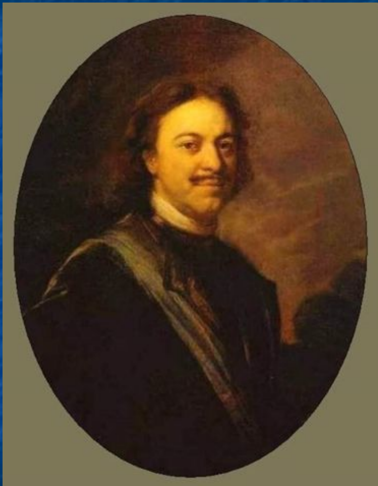
Портрет Петра I