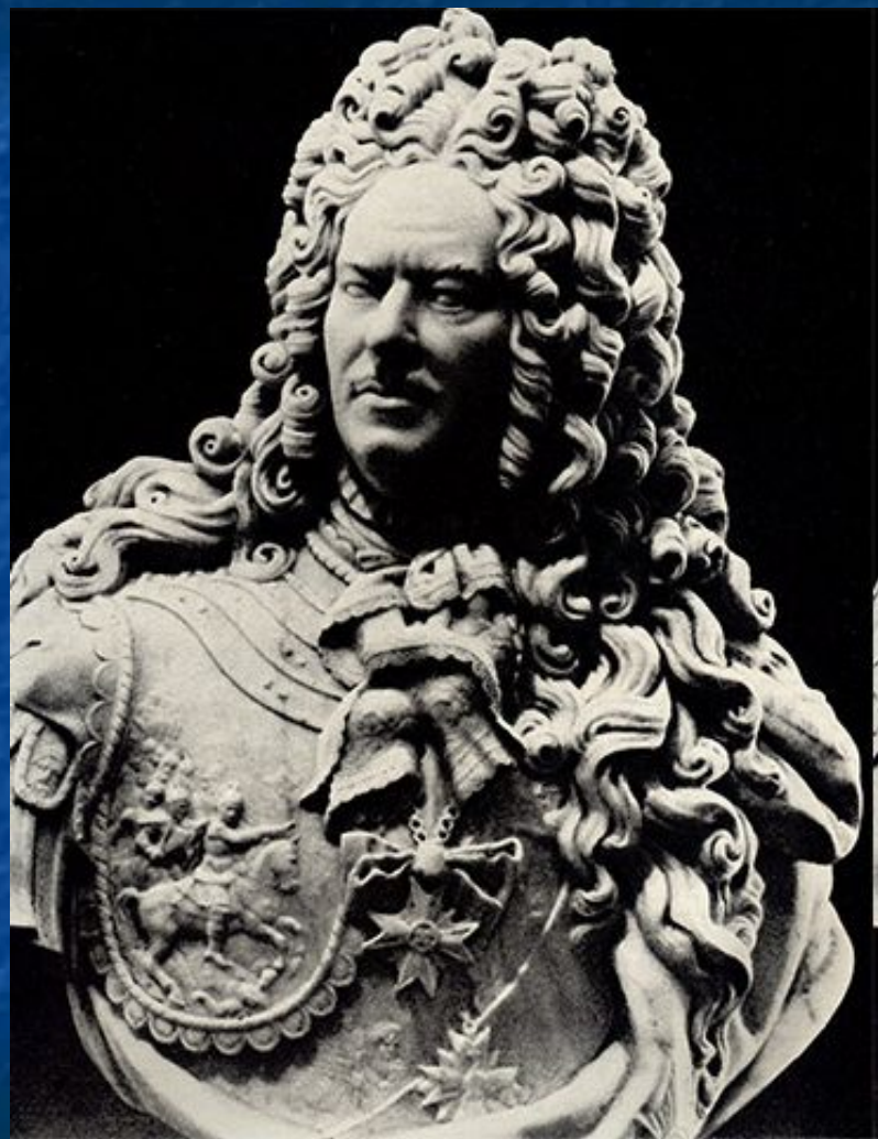
Восковая фигура А.Д. Меншикова