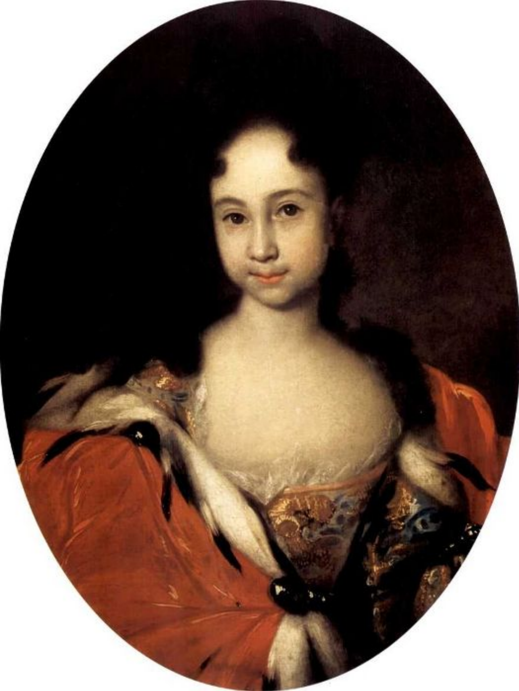
Портрет дочери Петра I Анны Петровны