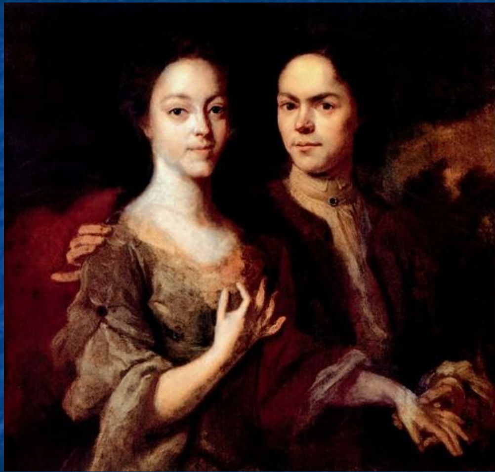
Автопортрет с женой