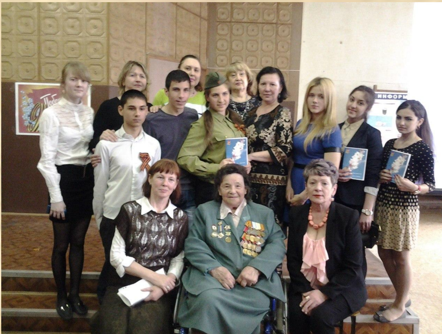
2014-04-29 Литературный конкурс в Ростовском колледже КРИПТ