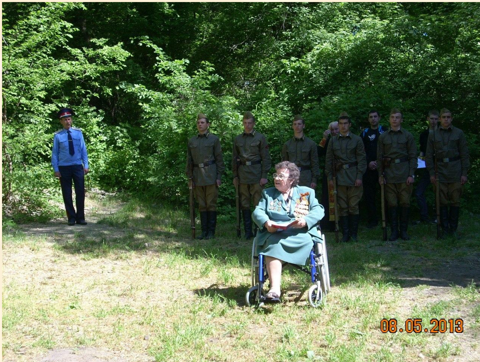
У обелиска 08.05.2013г.