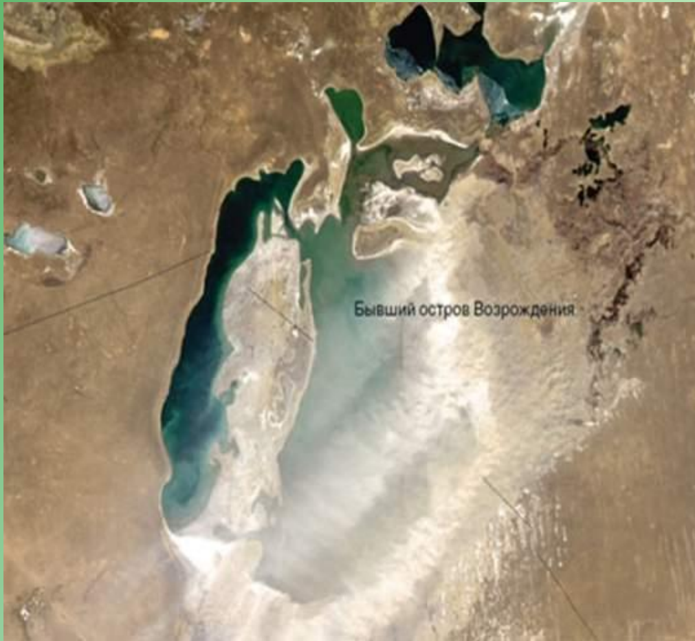
Бывший остров Возрождения