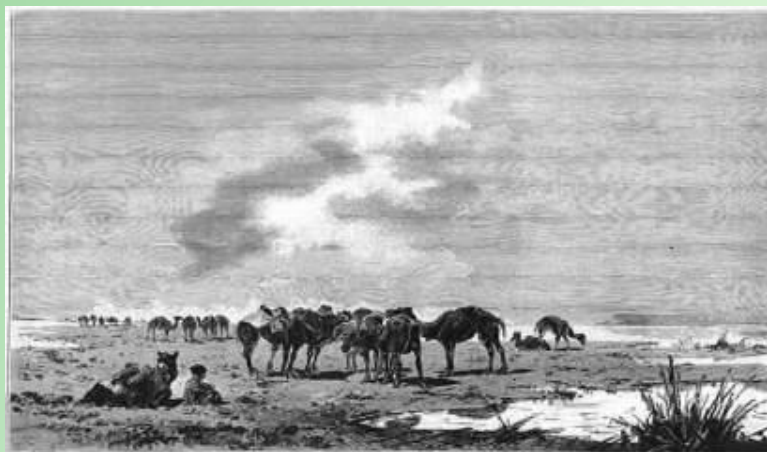
На берегах Арала. Фото 1900 г. С. Дарвин, изд. В. Дарвин.

Сегодня на интенсивное орошение полей хлопчатника и риса уходит значительная часть стока этих двух рек, что резко сокращает поступление воды в их дельты и, соответственно, в само море. Осадки в виде дождя и снега, а также подземные источники дают Аральскому морю намного меньше воды, чем ее теряется при испарении, в результате чего водный объем озера-моря уменьшается, а уровень солености возрастает