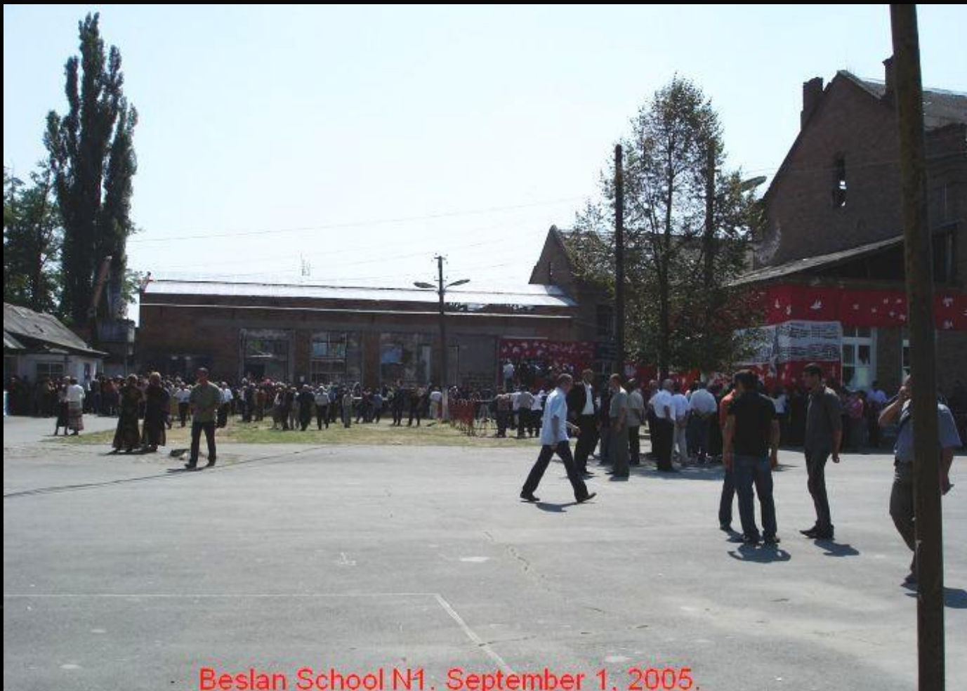
Beslan School N1. September 1, 2005.

10.50 – вокруг школы выставляется оцепление из бойцов ВВ, милиции и спецназа. К кольцу оцепления собираются родственники и жители города.