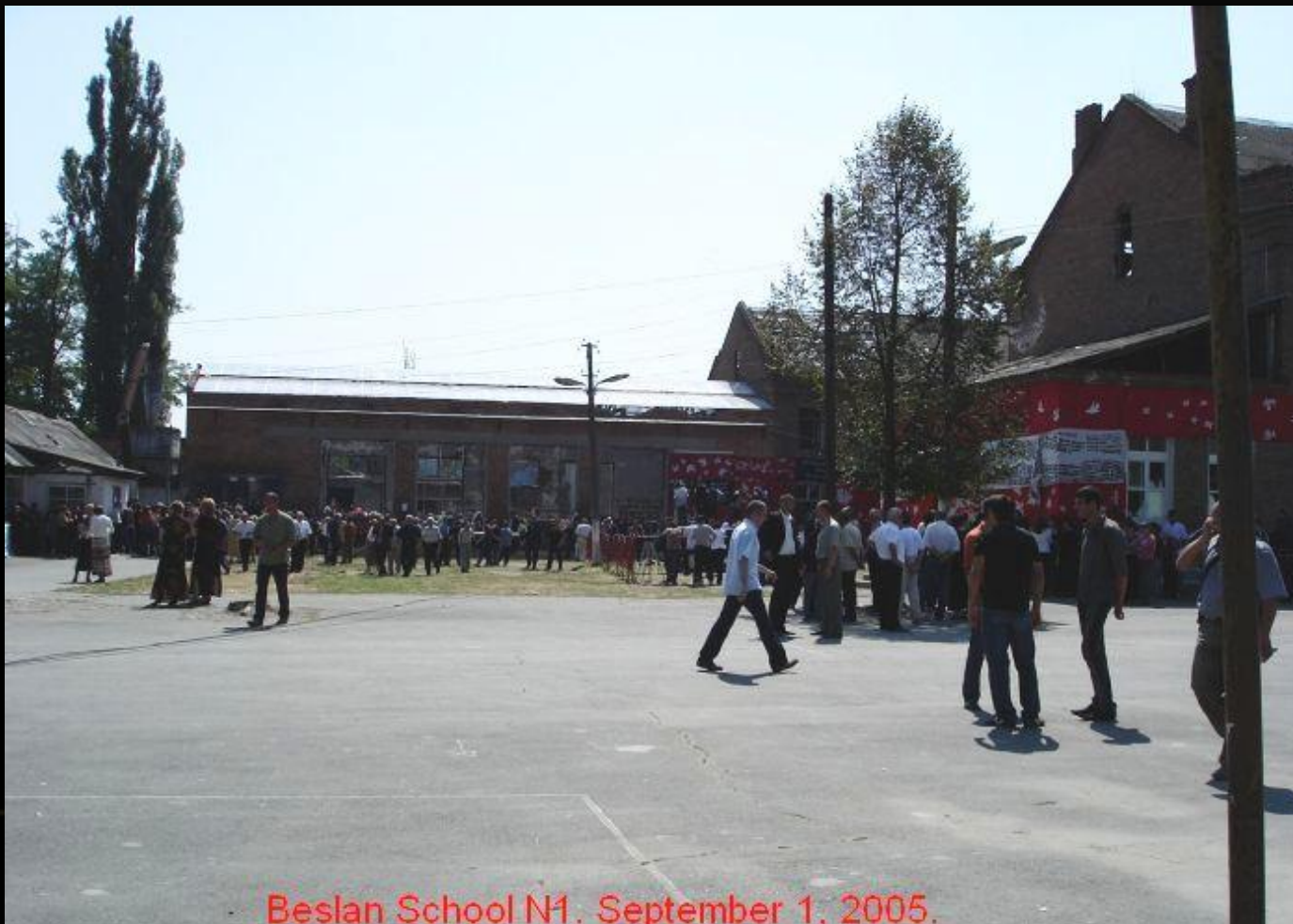
Beslan School N1. September 1, 2005.

10.50 – вокруг школы выставляется оцепление из бойцов ВВ, милиции и спецназа. К кольцу оцепления собираются родственники и жители города.