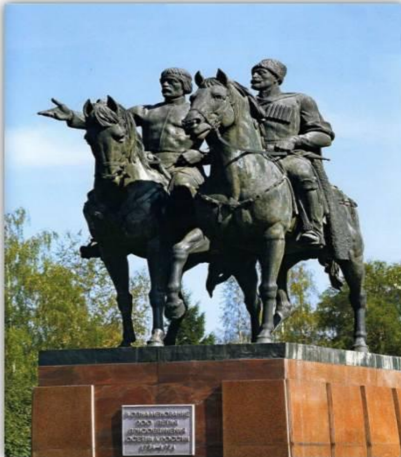
Монумент «Дружба народов»