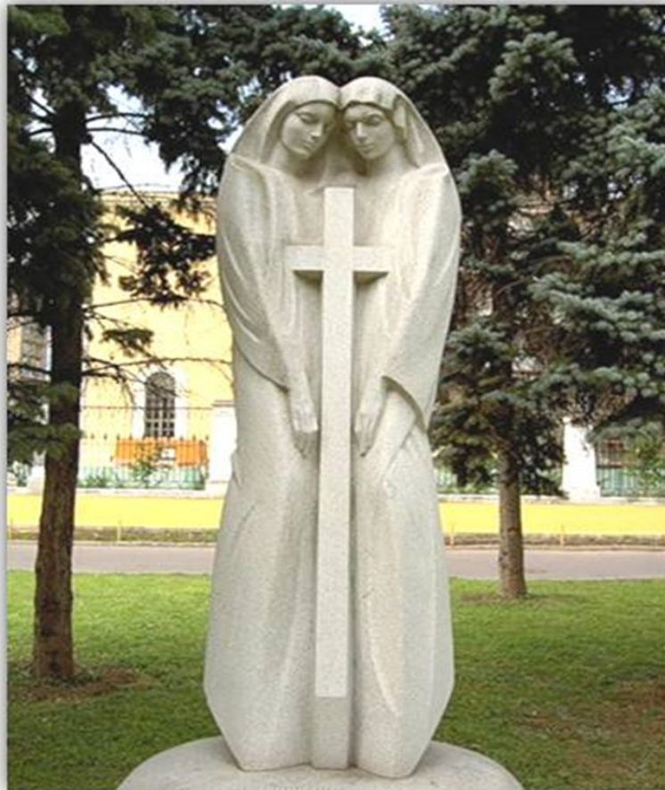
Скульптурная композиция "Благословенна в веках дружба народов России и Армении"