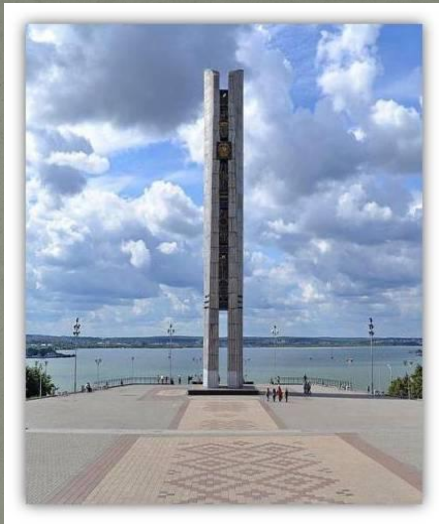
Монумент дружбы народов