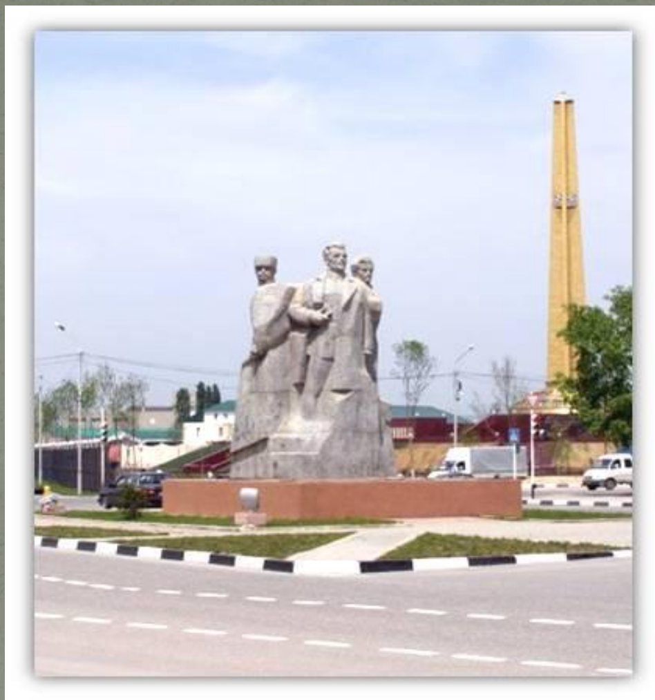
памятник Дружбы народов