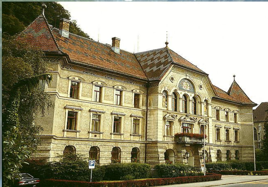
Здание правительства и парламента.

Лихтенштейн — конституционная монархия. Действующая конституция вступила в силу 5 октября 1921 года. Глава государства — Ханс-Адам II, князь фон унд цу Лихтенштейн, герцог Троппау и Егерндорф, граф Ритберг.