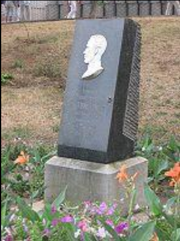
Стела в память участника обороны Севастополя 1854—1855 гг. Л. Н. Толстого у четвертого бастиона

Когда в конце 1853 г вспыхнула Крымская война Когда в конце 1853 г вспыхнула Крымская война, Толстой перевёлся в Дунайскую армию Когда в конце 1853 г вспыхнула Крымская война, Толстой перевёлся в Дунайскую армию, участвовал в сражениях, был в Севастополе .