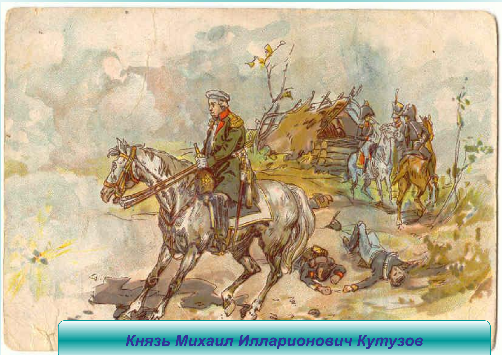
Князь Михаил Илларионович Кутузов