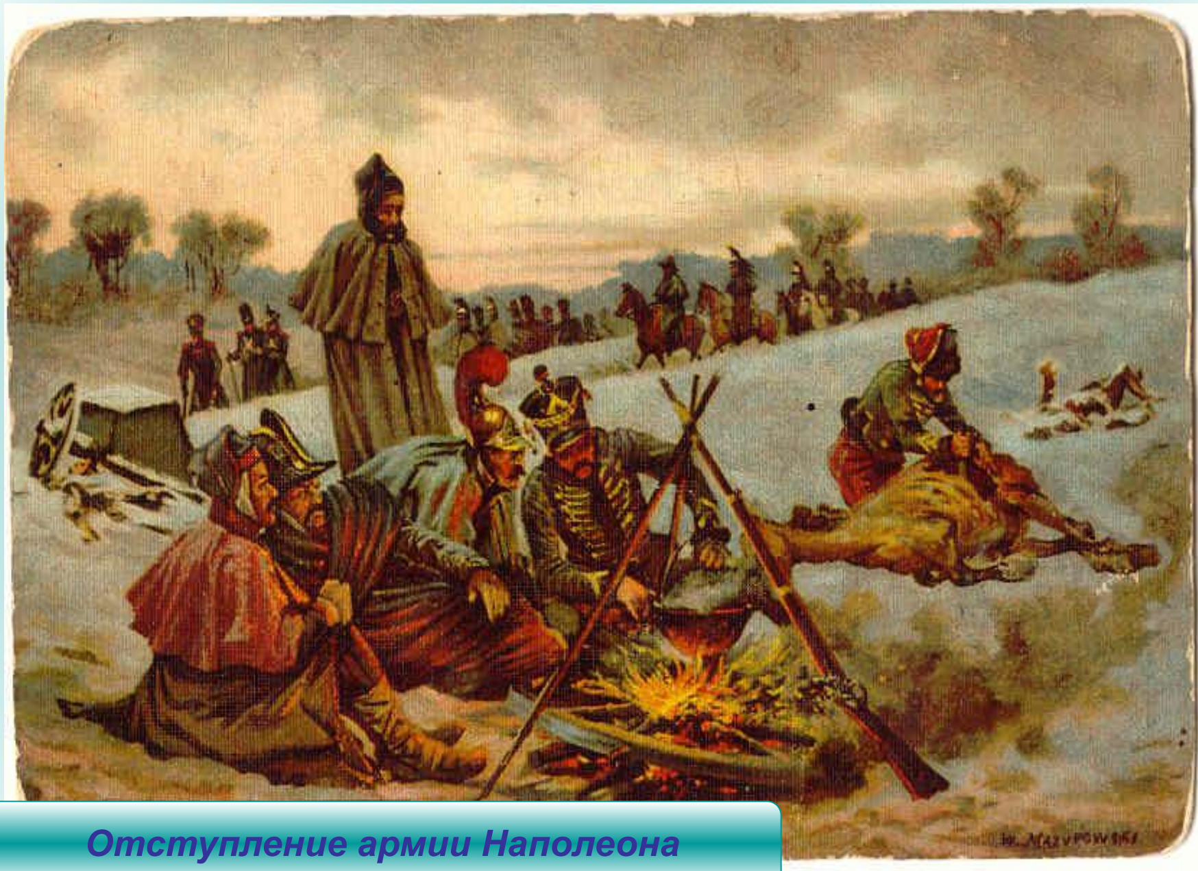
Отступление армии Наполеона