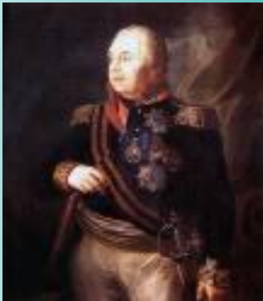
Михаил Илларионович Кутузов