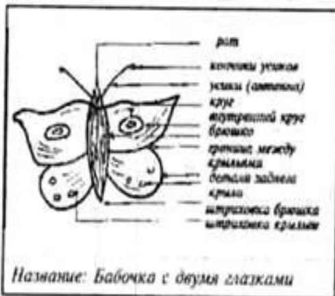
ПРИМЕР 3 Разработанность ответа: 12