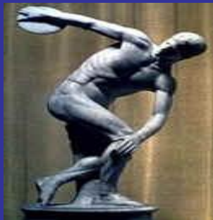
Дискобол, Греция, V-IV вв. до н.э.

Культурологический подход – это когда вся накопленная информация является достоянием мировой культуры.