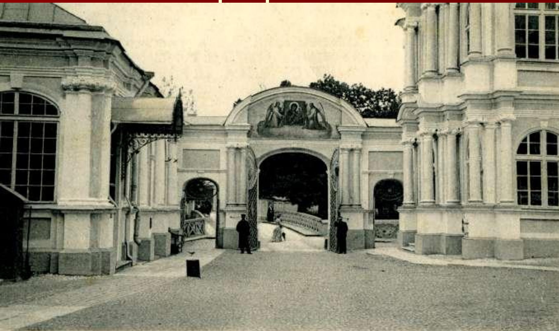
С. Петербургъ St.-Petersbourg