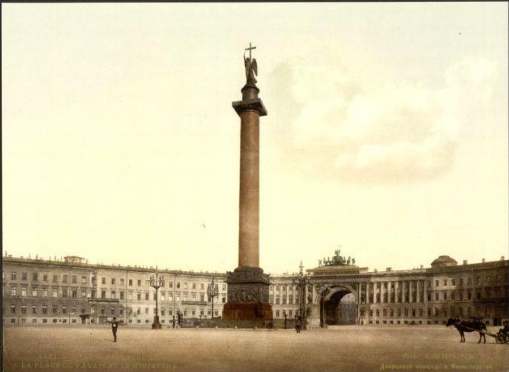
1856. ST. PETERSBURG. LA PLACE DU TRAVAI ET DES MINISTRES