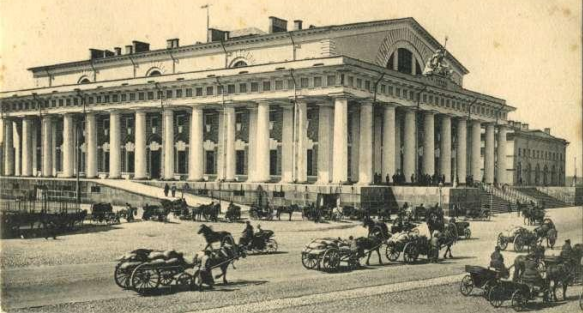
С.-ПЕТЕРБУРГЪ. Биржа ST.-PETERSBOURG. Bourse