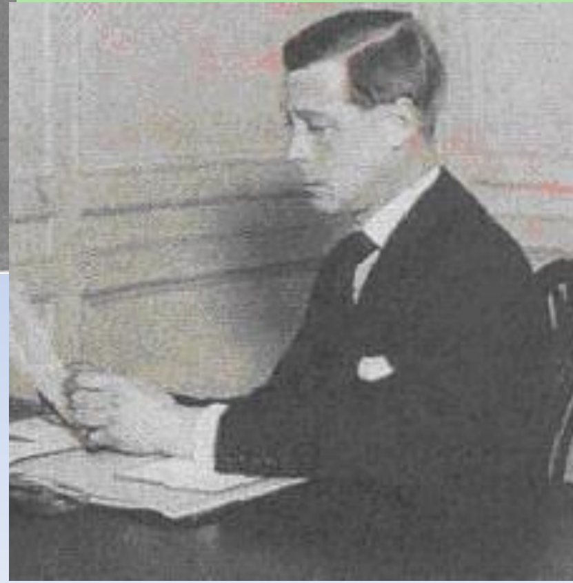
Король Едуард VIII»