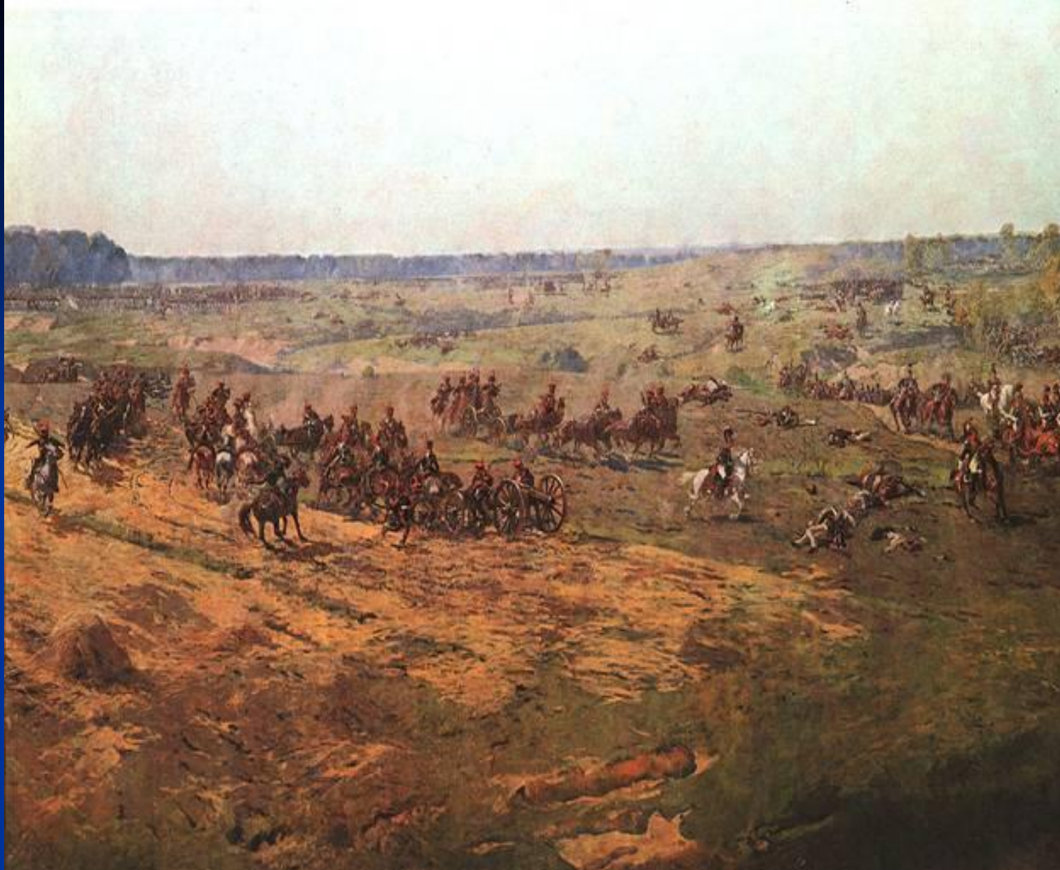
Командный пункт Наполеона. 1812 г.