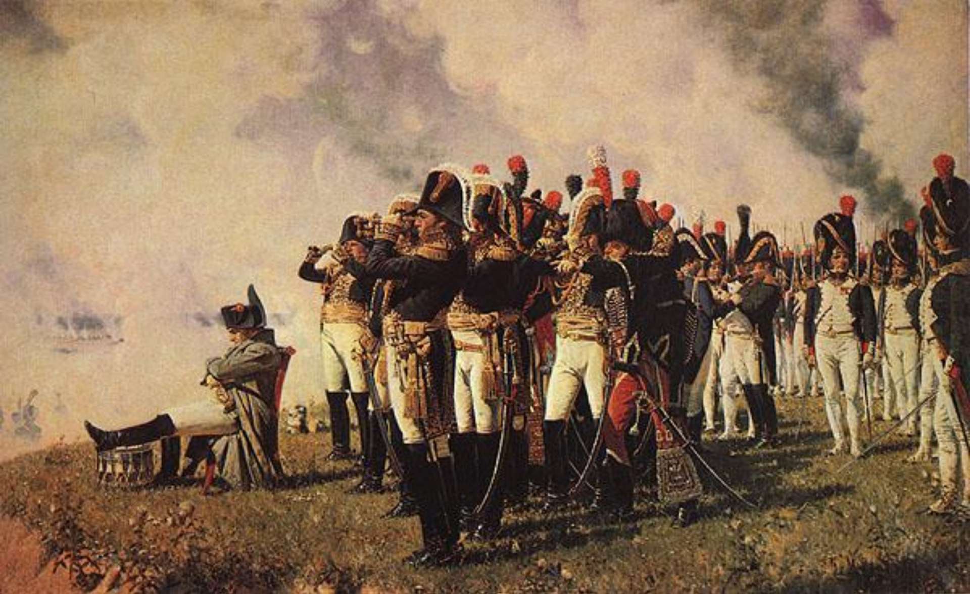
Наполеон на Бородинских высотах