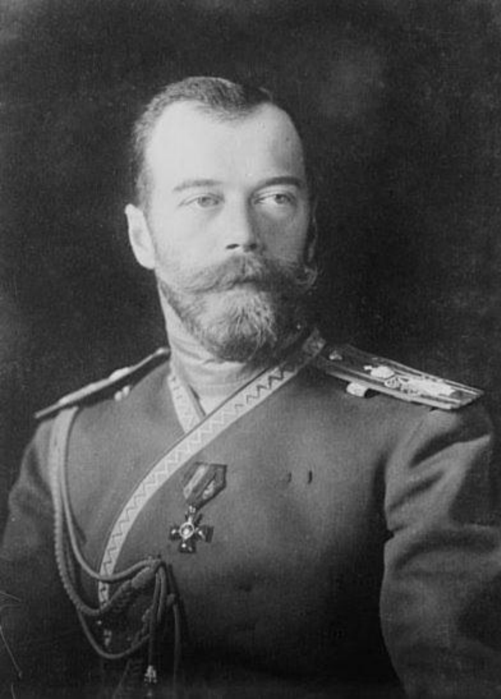
Николай Второй Александрович Романов. Правление 1984-1917гг.