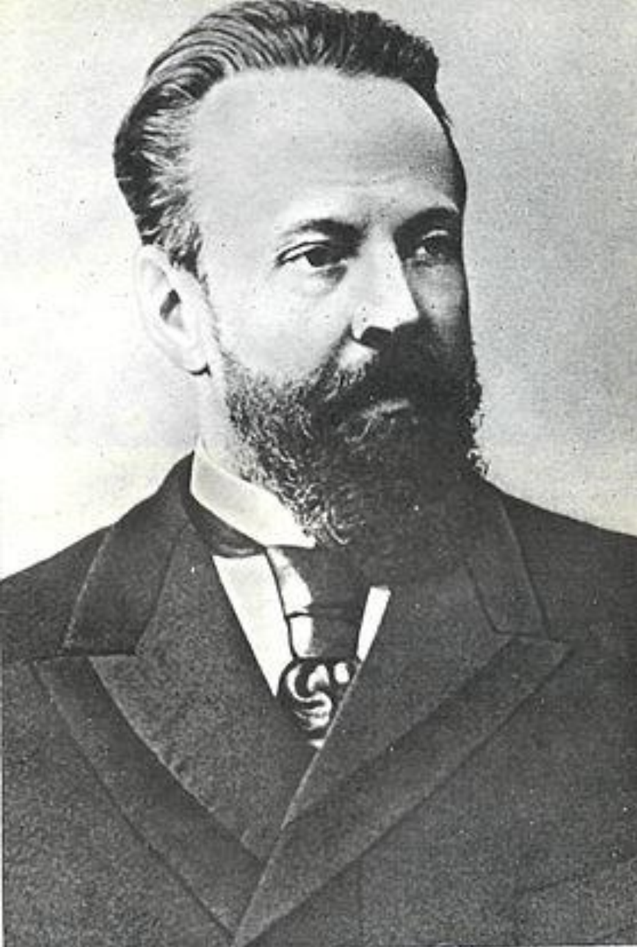
Сергей Юльевич Витте. Министр финансов.