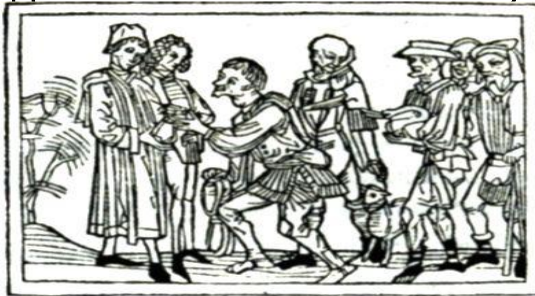
Крестьянин сдает оброк. Гравюра (XV в.)

За пользование землей зависимые крестьяне должны были нести феодальные ПОВИННОСТИ (принудительные обязанности)