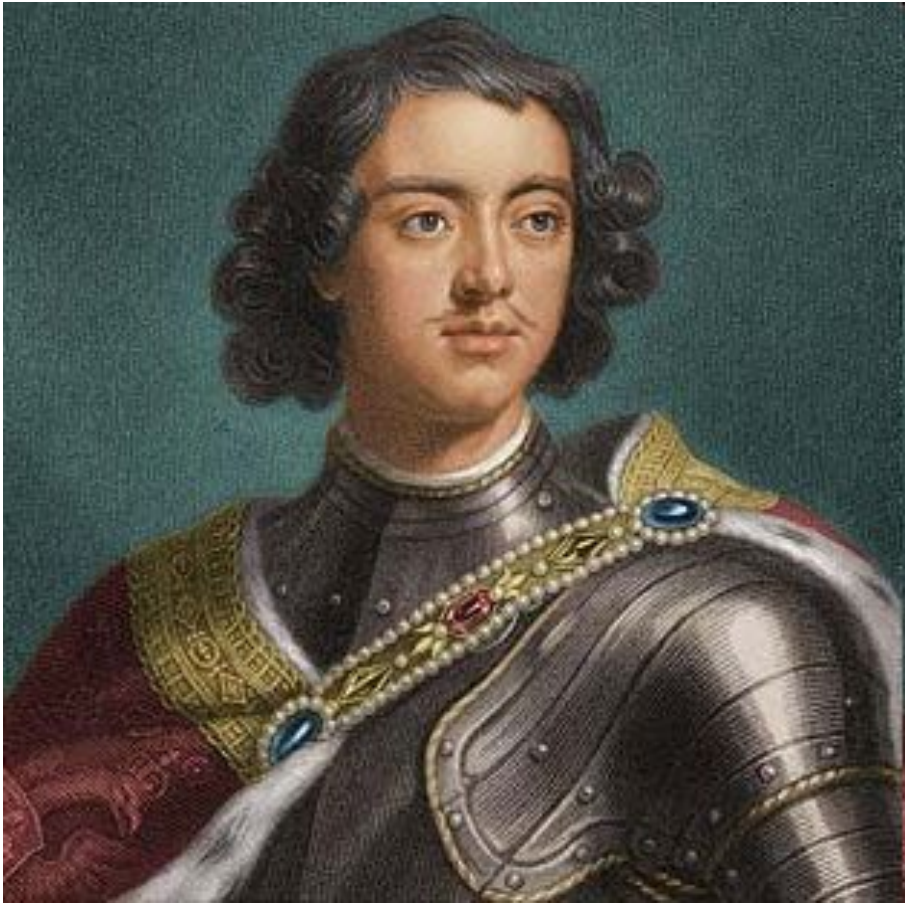
Портрет написан с натуры учеником Рембрандта сэром Готфридом Неллером ( Godofroy Kneller ) 9 сентября 1697 г. во время пребывания Петра I в Утрехте в гостях у Вильгельма III.

Перед отъездом Петр приказал выгравировать на своей печати надпись: "Аз бо есмь в чину учимых и учащих мя требую" - "Я ученик и еду искать учителей" .