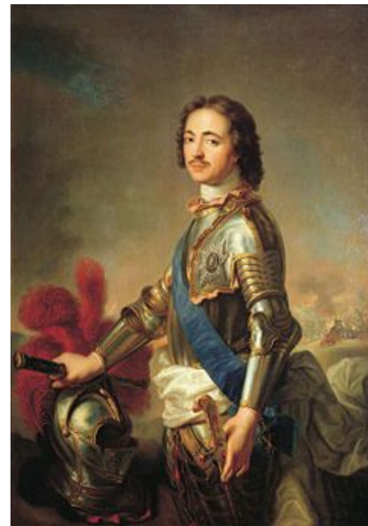
Jean-Marc Nattier, 1717

В ходе реформ произошел переход к преимущественному использованию принудительного труда крепостных крестьян на мануфактурах и заводах.