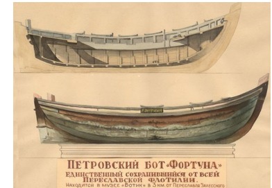
ПЕТРОВСКИЙ БОТ-ФОРТУНА — ЕДИНСТВЕННЫЙ СОХРАНИВШИЙСЯ ОТ ВСЕЙ ПЕТРОВСКОЙ ЧЕЛМТЯВИ. Находится в музее «Ботика» в Зимнем саду Петербурга. Эскизы