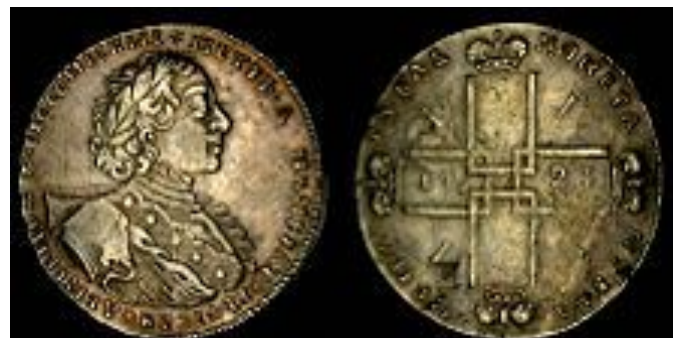
Полушка, гривенник и рубль 1723 г.