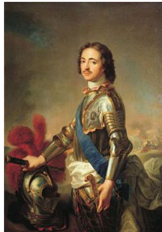
Jean-Marc Nattier , 1717

В ходе реформ произошел переход к преимущественному использованию принудительного труда крепостных крестьян на мануфактурах и заводах.