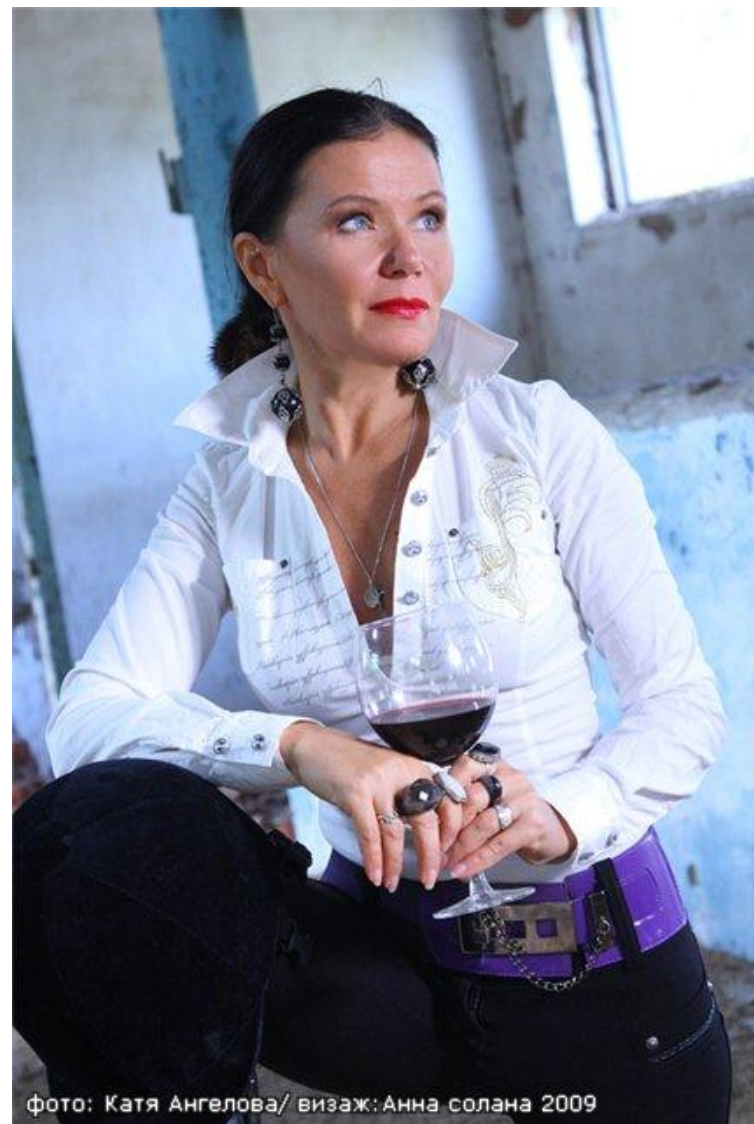
визаж: Анна солана 2009