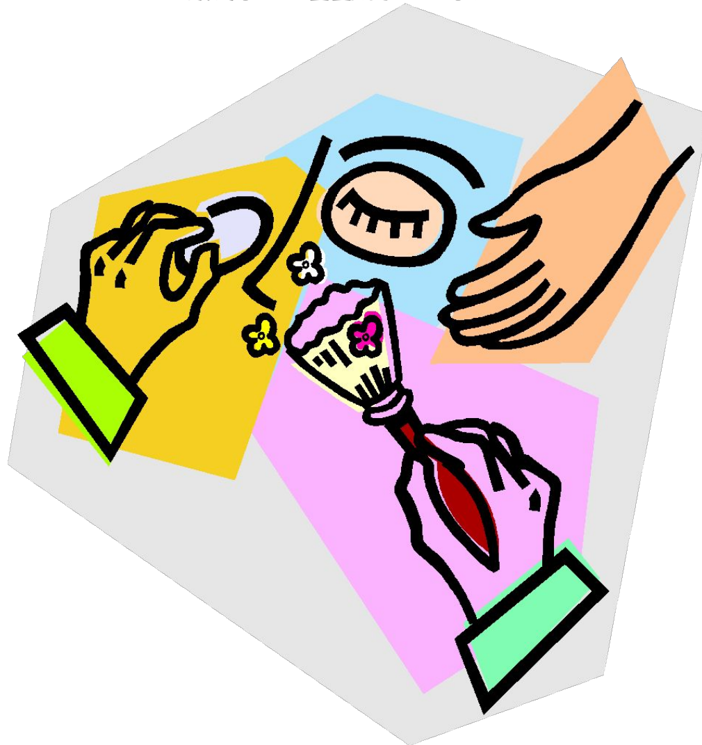
Схема нанесения возрастного макияжа