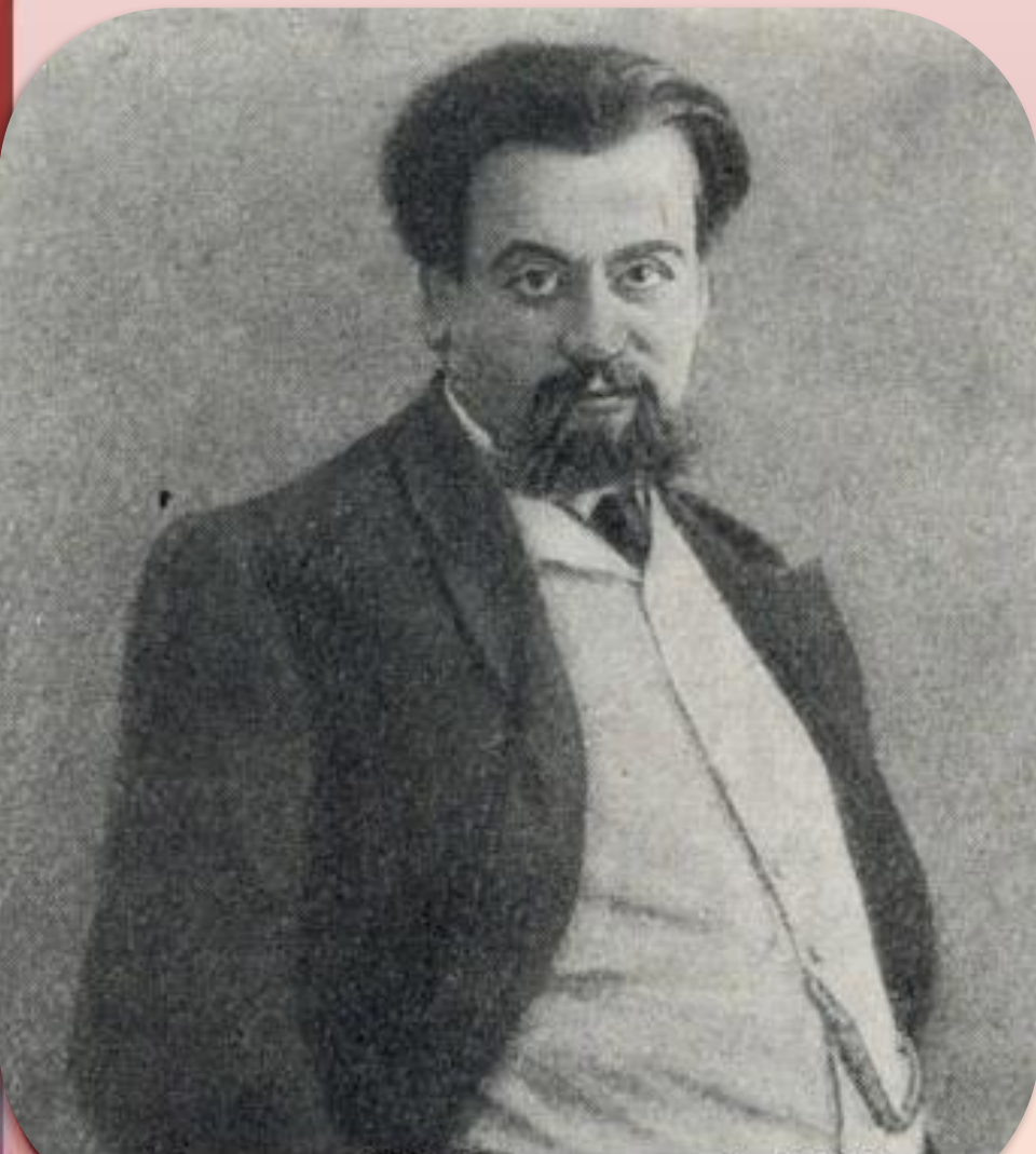
Лопехин (Л.М. Леонидов). 1904 г.

«... Музыка... Грай іде новий господар саду... За все можу заплатити...»