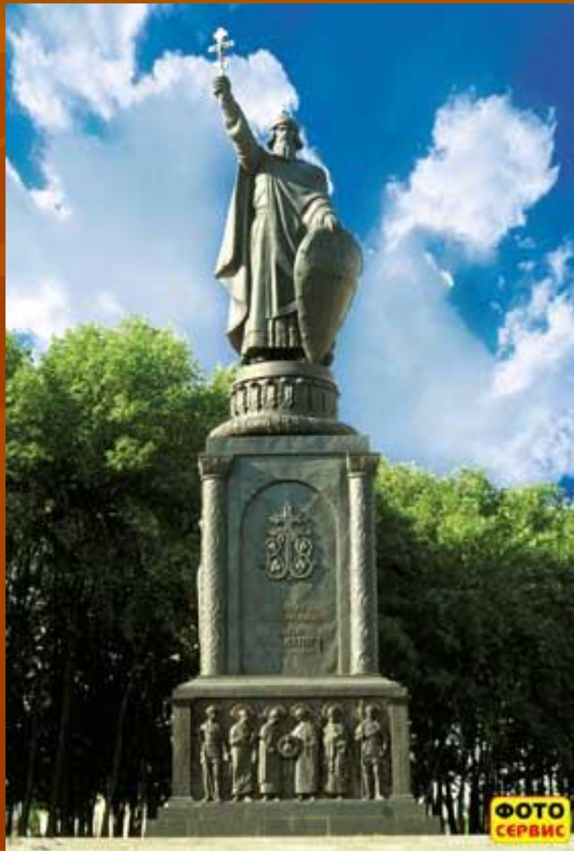
Памятник князю Владимиру Красное солнышко в Белгороде.