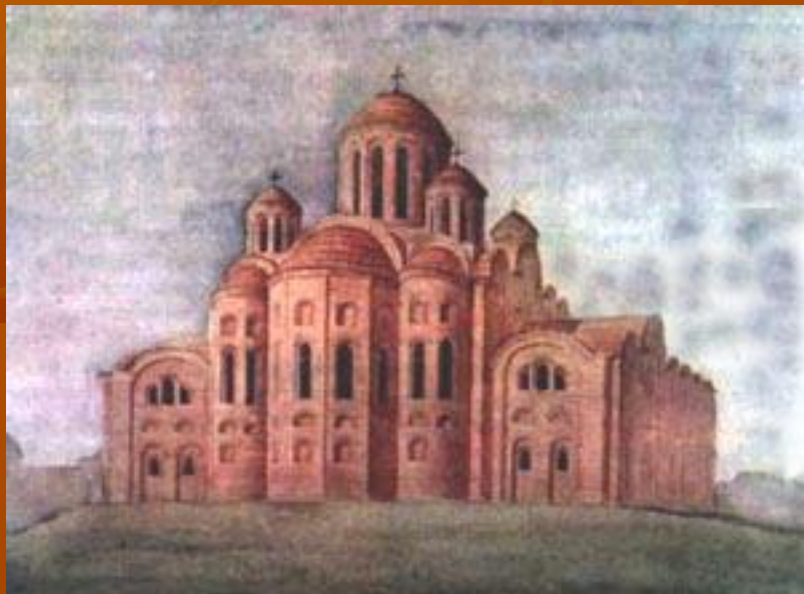
Десятинная церковь в Киеве.