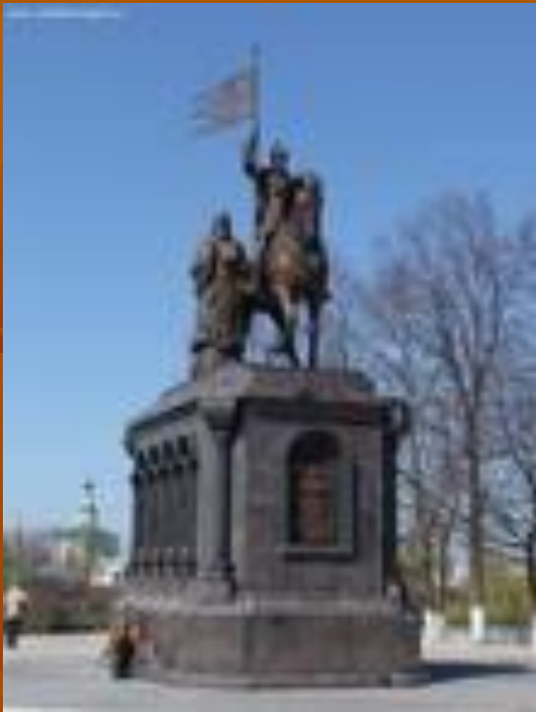
Памятник князю Владимиру Красное Солнышко и святителю Федору