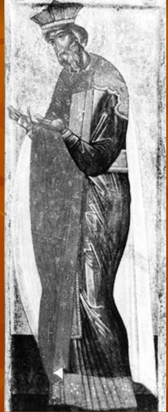
Владимир Святой. Икона.