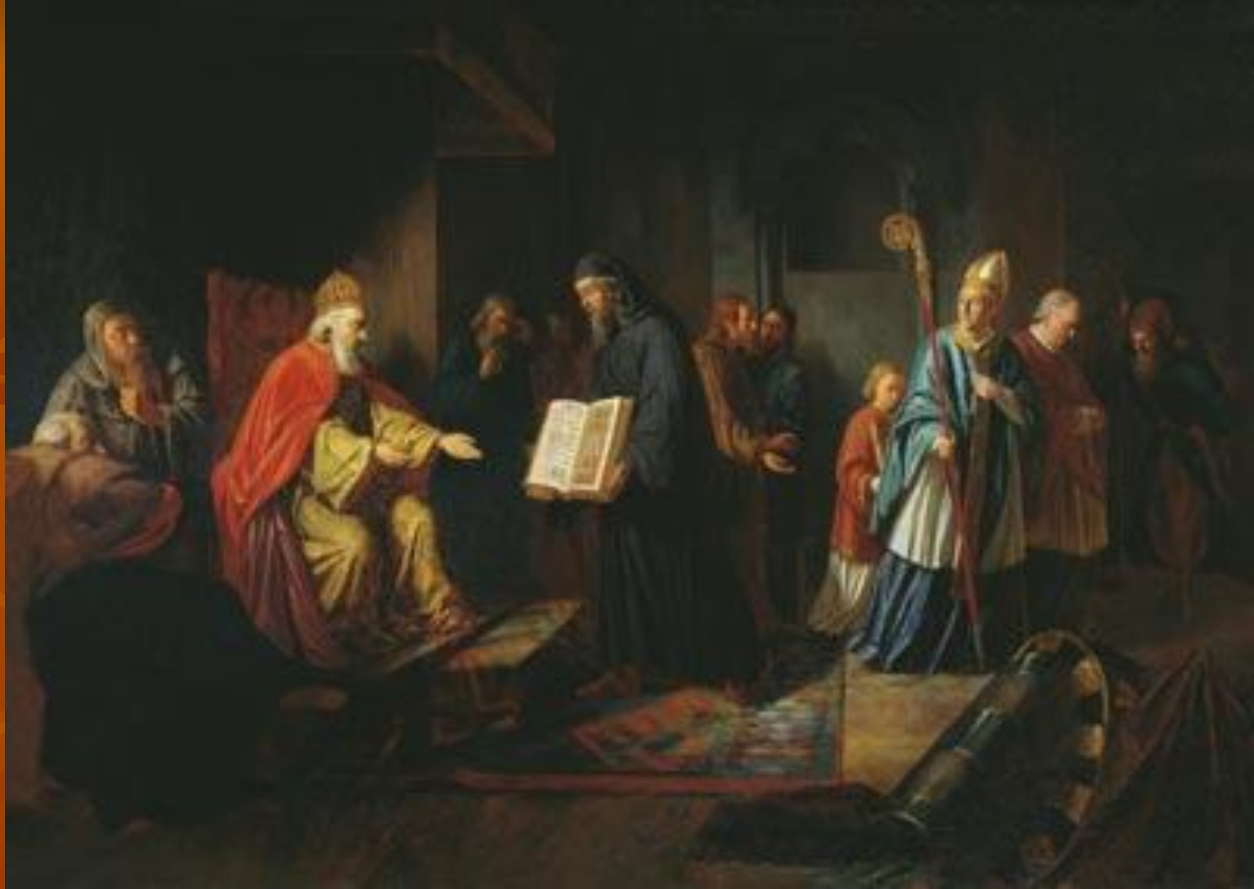
Великий князь Владимир выбирает веру