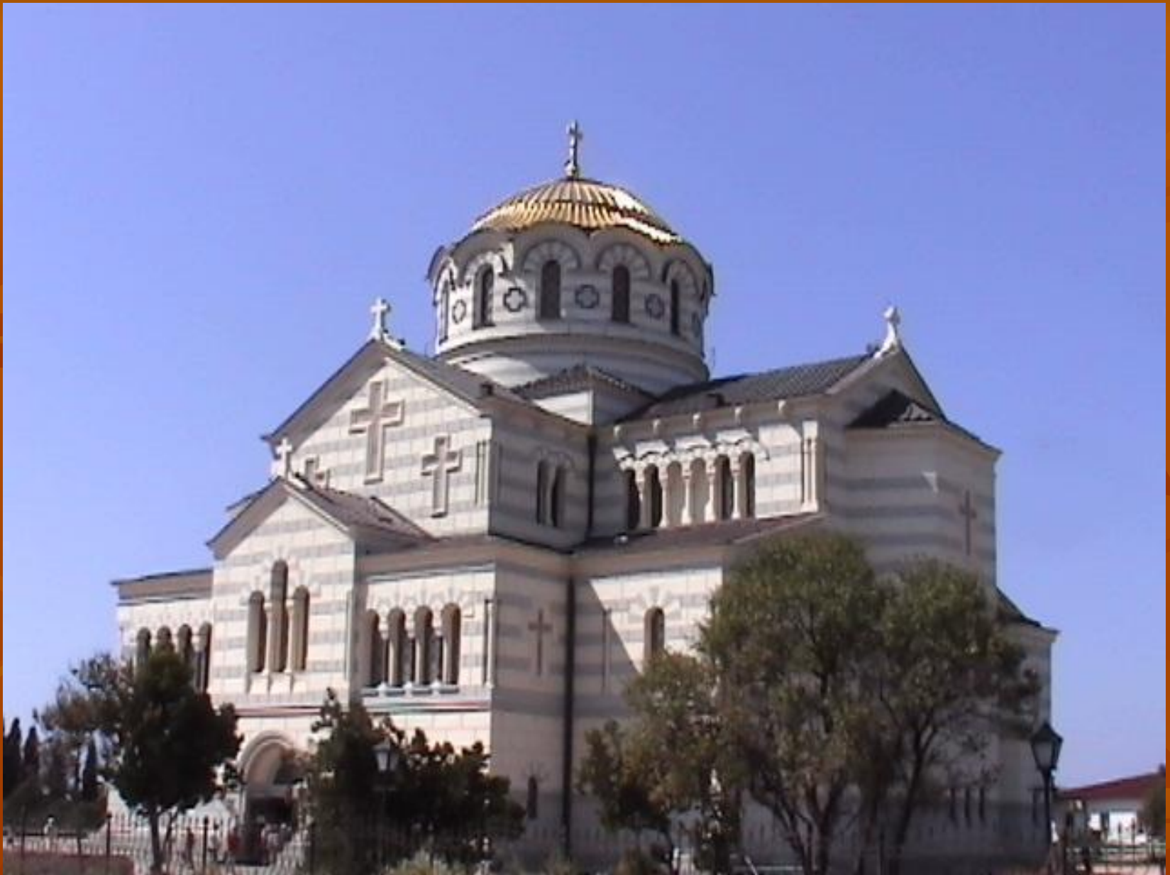
Храм Владимира Красное Солнышко.