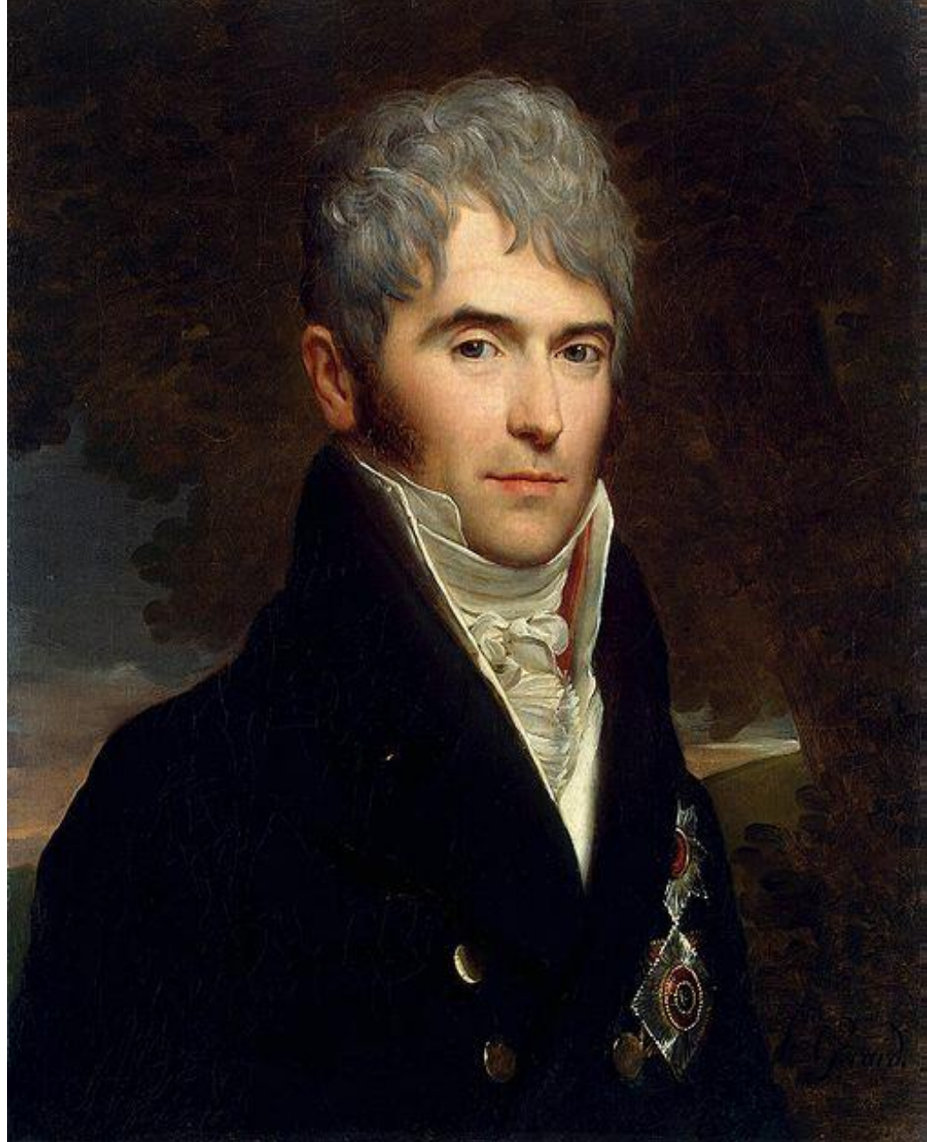
Ф. Жерар Портрет В. Кочубея