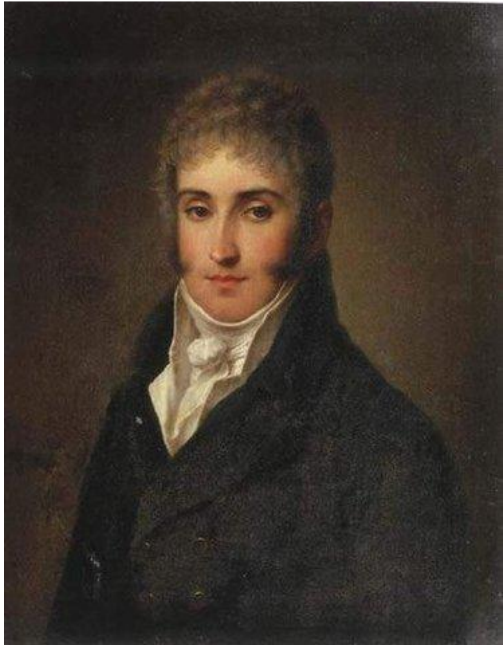
Автор неизвестен. Портрет А.

Адам Ежи Чарторыйский (1770-1861) Польский и российский государственный деятель, писатель, меценат, князь. Друг и соратник Александра I. Входил в Негласный