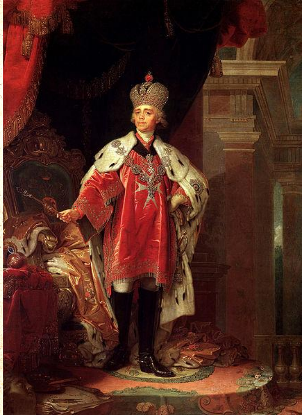
В. Л. Боровиковский Портрет

Павел I передал Александрю I своё пристрастие к военному делу. Научил сына совмещать душевную любовь к человечеству с практической заботой о ближнем.