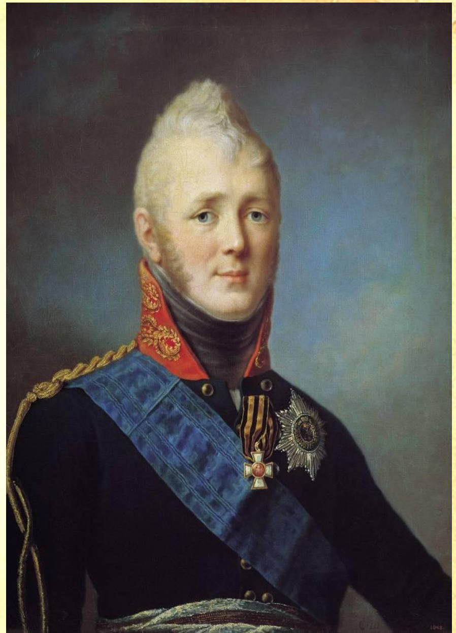
Щукин С.С. Портрет

Сразу после рождения Александра забрала у родителей бабушка – императрица Екатерина II, которая намеревалась воспитать внука