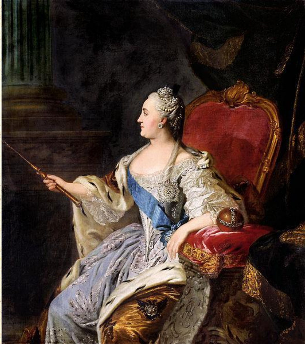
Ф. С. Рокотов. Портрет Екатерины

Прививала внуку идеи Просвещения и либерализма. Хотела сделать императором внука, а не сына Павла.