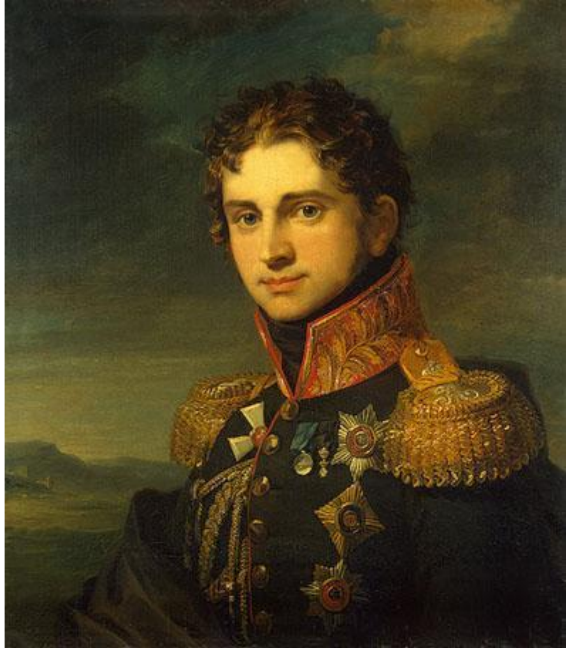
Автор неизвестен. Портрет из Военной