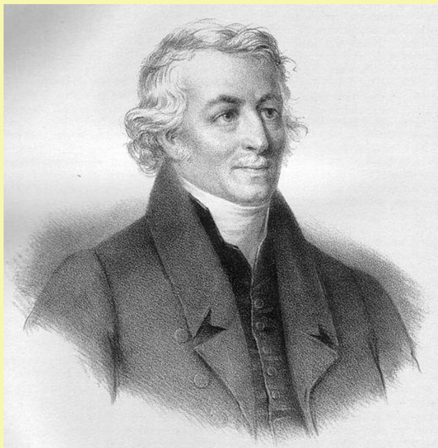
Фредерик Сезар Лагарп, воспитатель Александра I