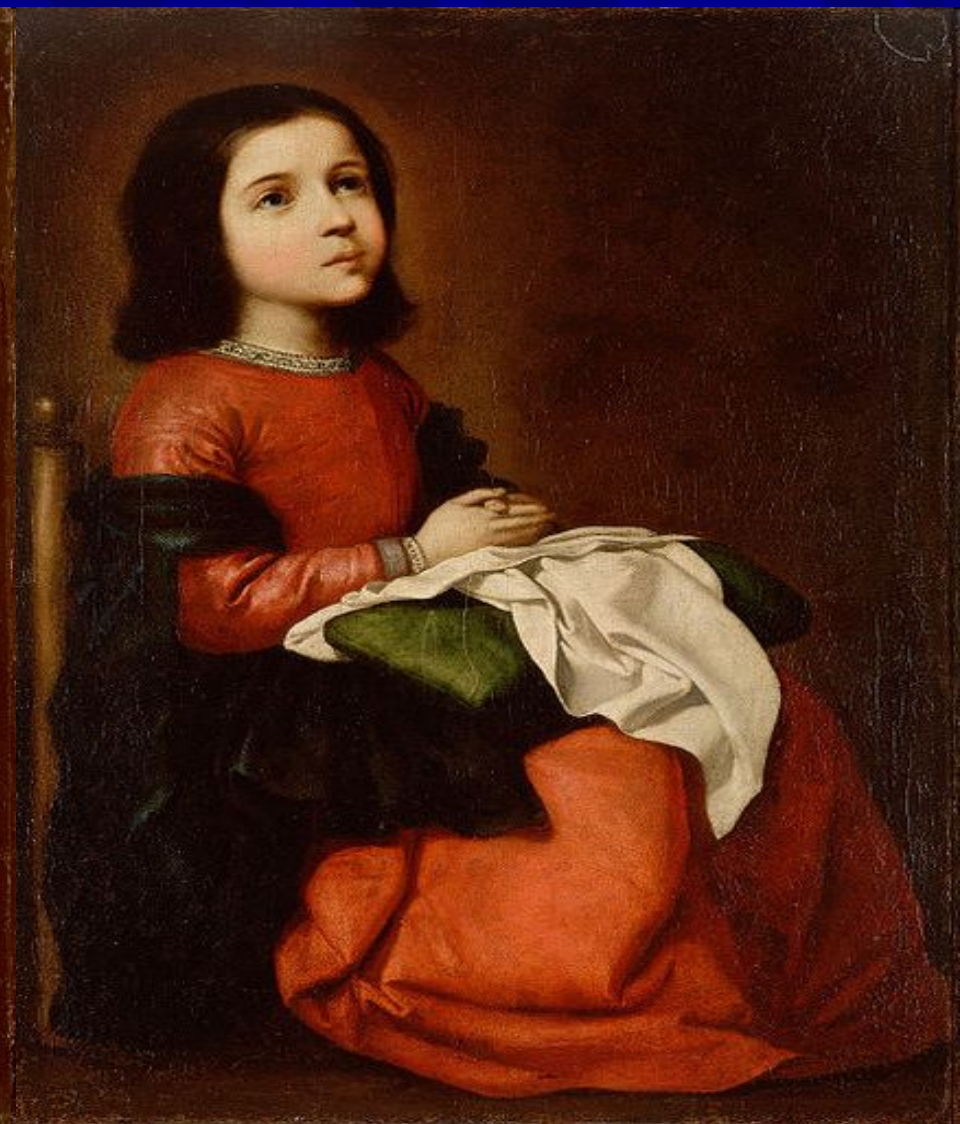
• Худ. Ель Греко, поет Алонсо Ерсілья і Суньїга