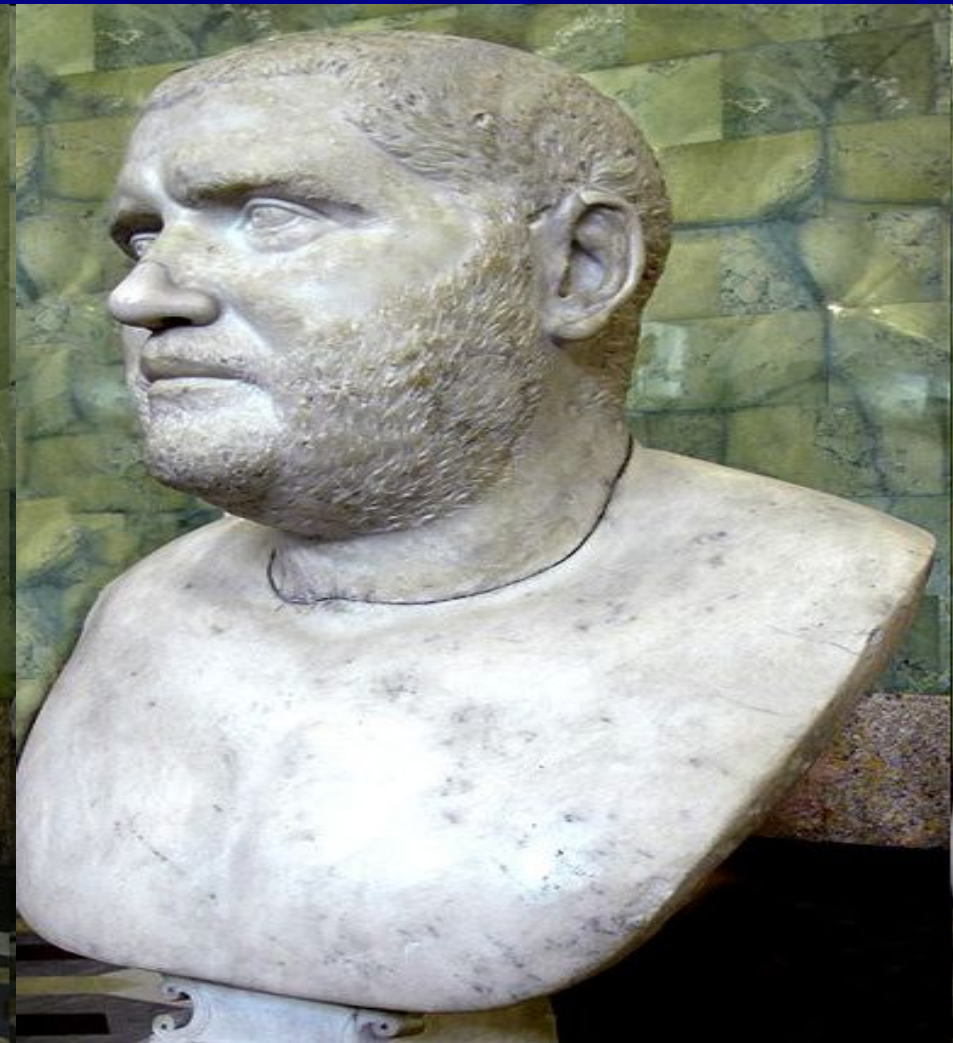
• Імператор Люцій Вер