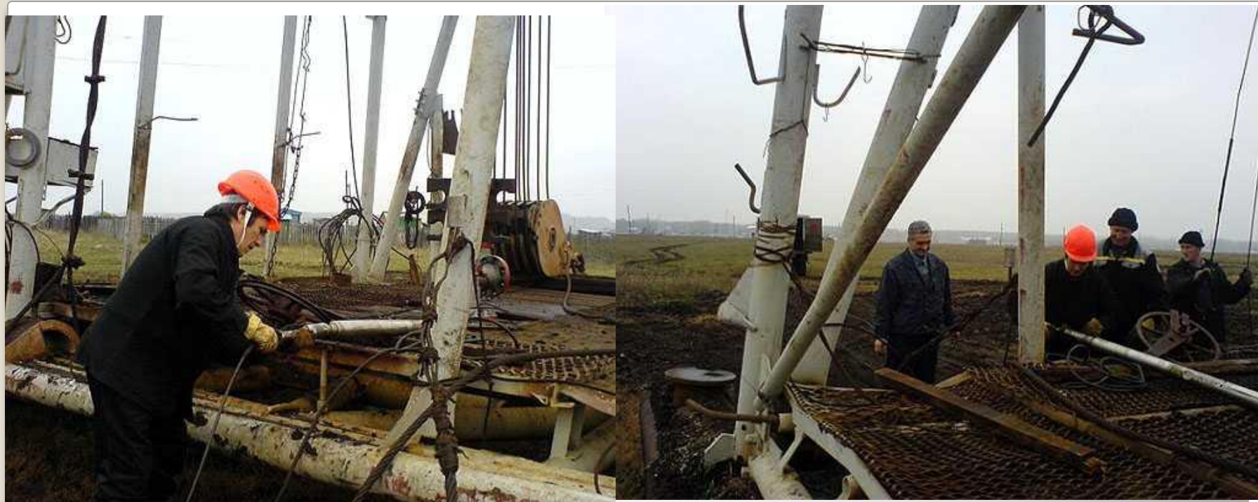
Подсоединение кабельного наконечника к скважинному прибору "Сканер-2000"