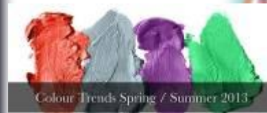
Colour Trends Spring / Summer 2013