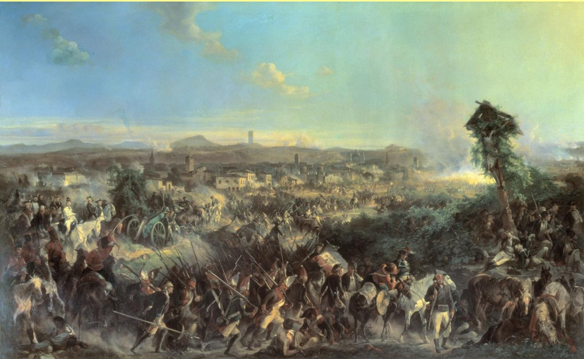
Битва при Нови. Худ. А. Коцебу.

15 августа Суворов разгромил французов при Нови.