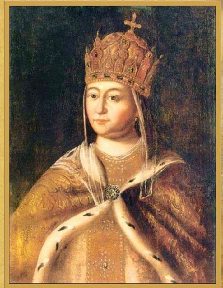
Парсуна с изображением Евдокии Фёдоровны Лопухиной