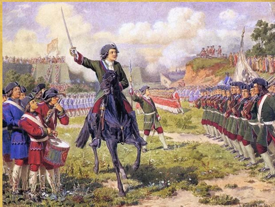
А.Д.Кившенко «Военные игры потешных войск Петра I под селом Кожухово» 1880 год