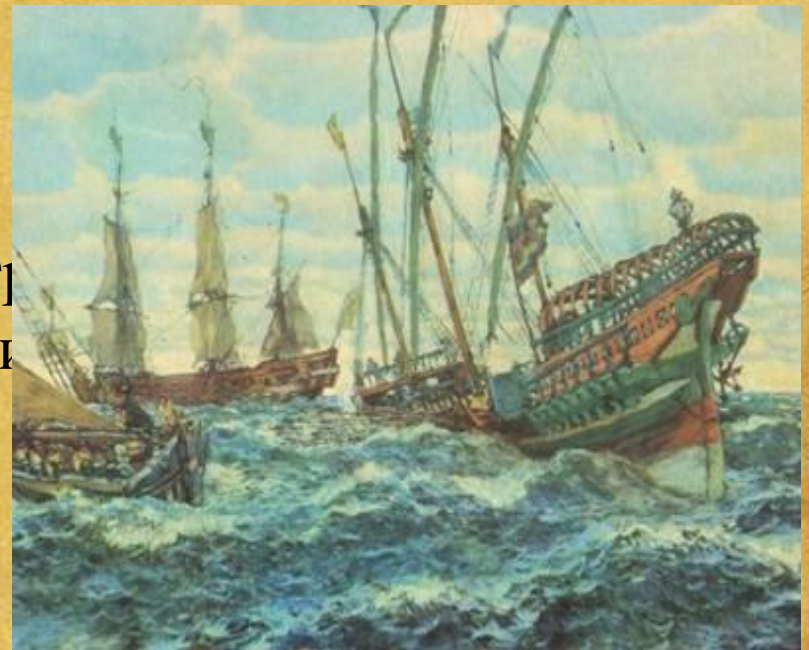
Е. Е. Лансере. Корабли времен Петра I. 1911

1696 г.- второй поход на Азов. Петр учел все ошибки первого похода и исправил. Крепость вскоре пала.