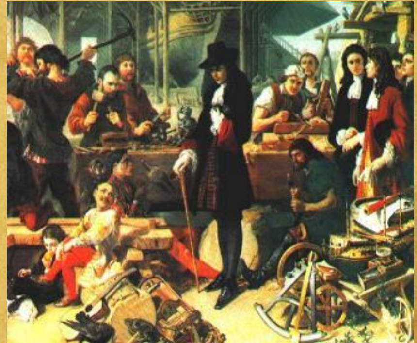
Даниель Маклиз. Середина XIX в. «Петр I в Дептфорде в 1698 г.» Из собрания Лондонской галереи.