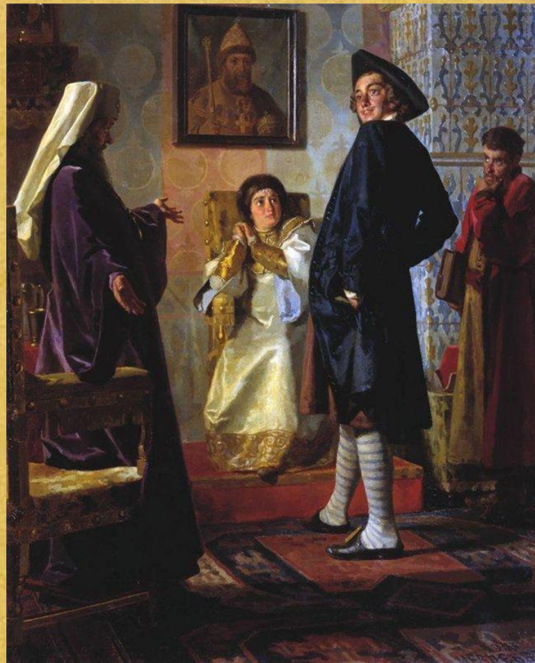
Николай Неврев «Пётр I в иноземном наряде» 1903 г.