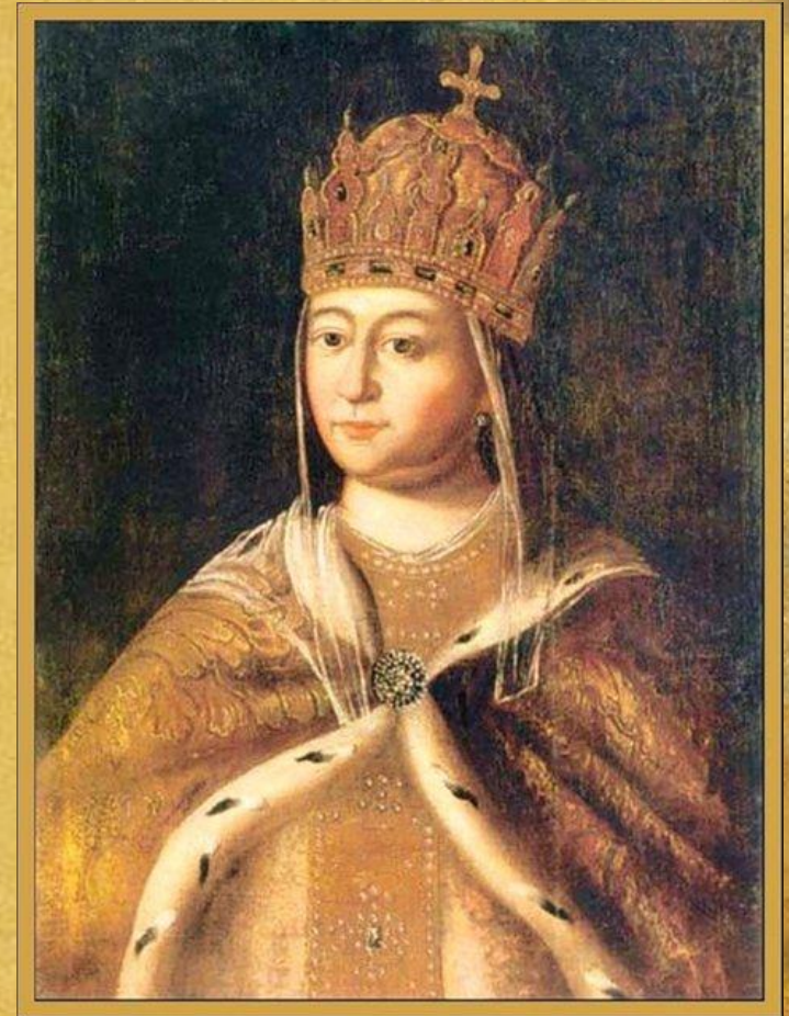
Парсуна с изображением Евдокии Фёдоровны Лопухиной