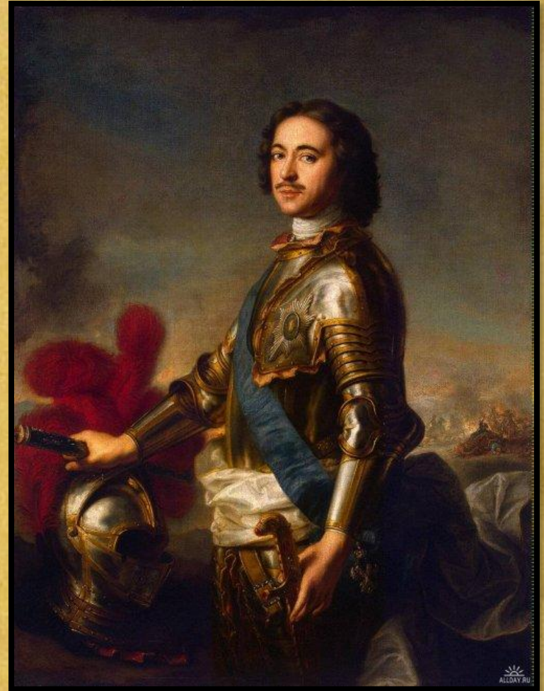
Натье Жан Марк «Портрет Петра I в рыцарских доспехах»