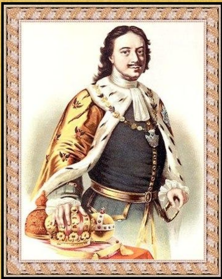
Петр I Алексеевич (1682-1725)

«Петр - это вся Россия; её плоть и дух, характер и гений...»