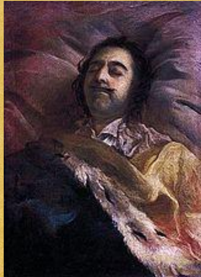
И. Н. Никитин «Пётр I на смертном одре»