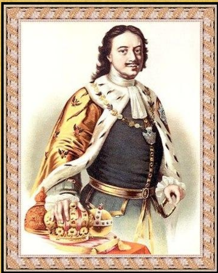
Петр I Алексеевич (1682-1725)

«Петр - это вся Россия; её плоть и дух, характер и гений...»