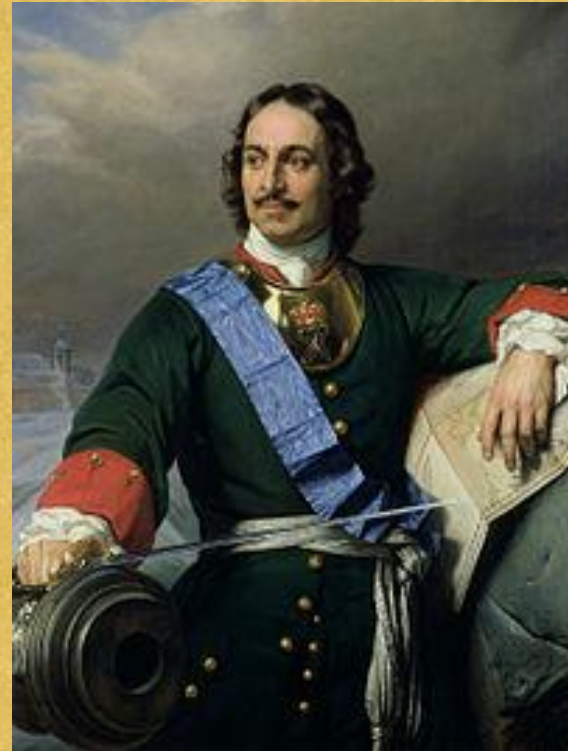
Портрет Петра I. Поль Деларош (1838)