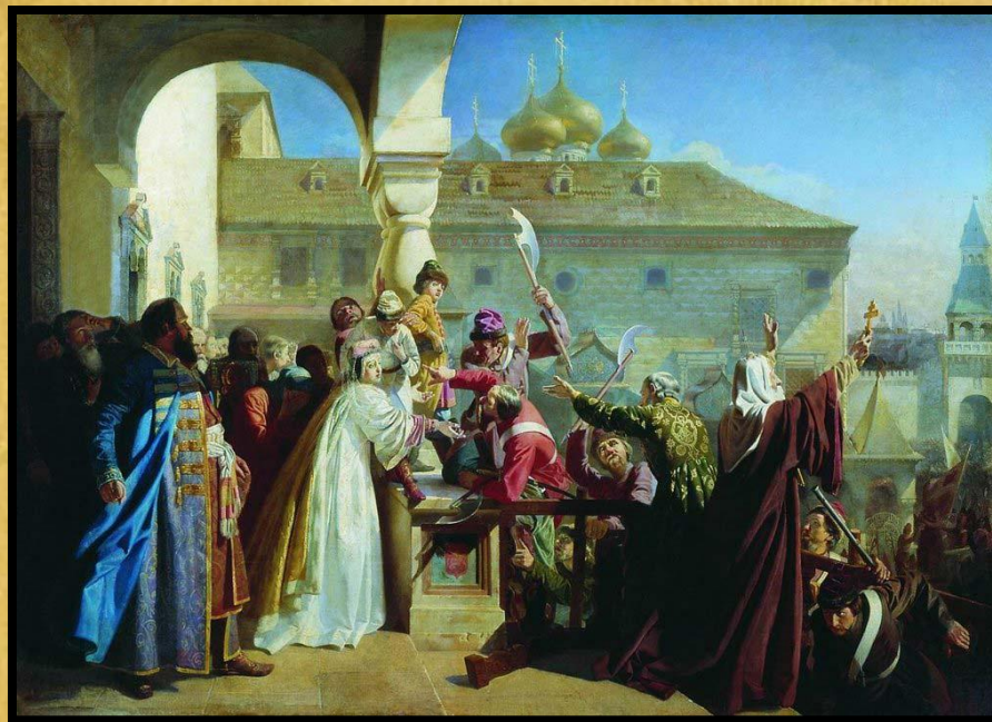
Н.Дмитриев-Оренбургский «Стрелецкий бунт» (1862)

В 10 лет, в 1682 году, Петр становится царем. После смерти Федора Алексеевича встал вопрос, кому наследовать престол: старшему слабоумному Ивану или малолетнему Петру. И тогда выбрали Петра. 1682 г. – Стрелецкий бунт. Стрельцы недовольны тем, что Петр стал царем. Вскоре обе стороны договорились, и на престол восходит старшая сестра Петра – Софья Алексеевна.