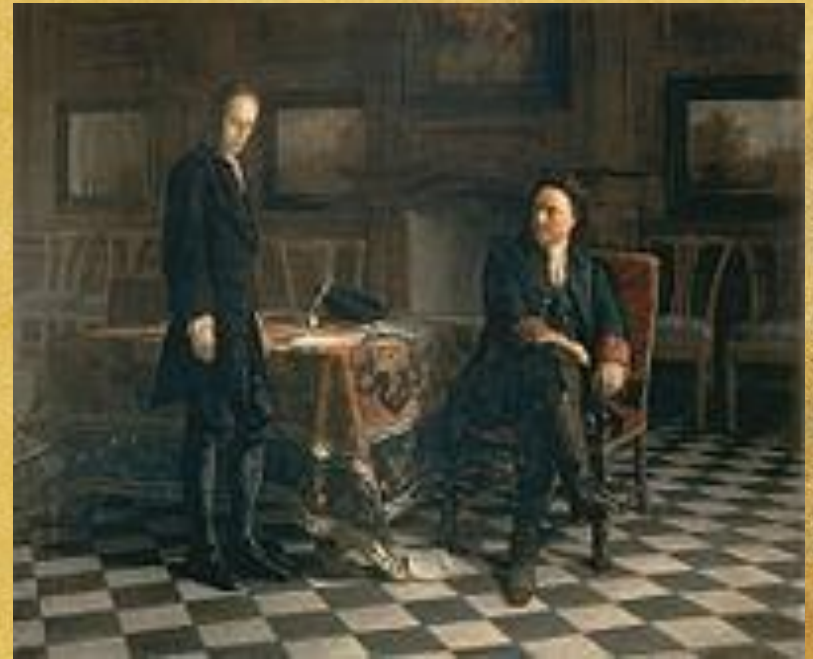
«Пётр I допрашивает царевича Алексея» Ге Н. Н., 1871

1716г.-бежал в Австрию,но все равно был возвращен в Россию, приговорен к казни, однако умер в тюрьме.