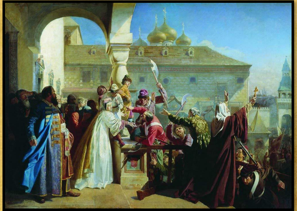
Н. Дмитриев-Оренбургский «Стрелецкий бунт» (1862)