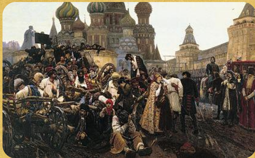
В. И. Суриков. «Утро стрелецкой казни»