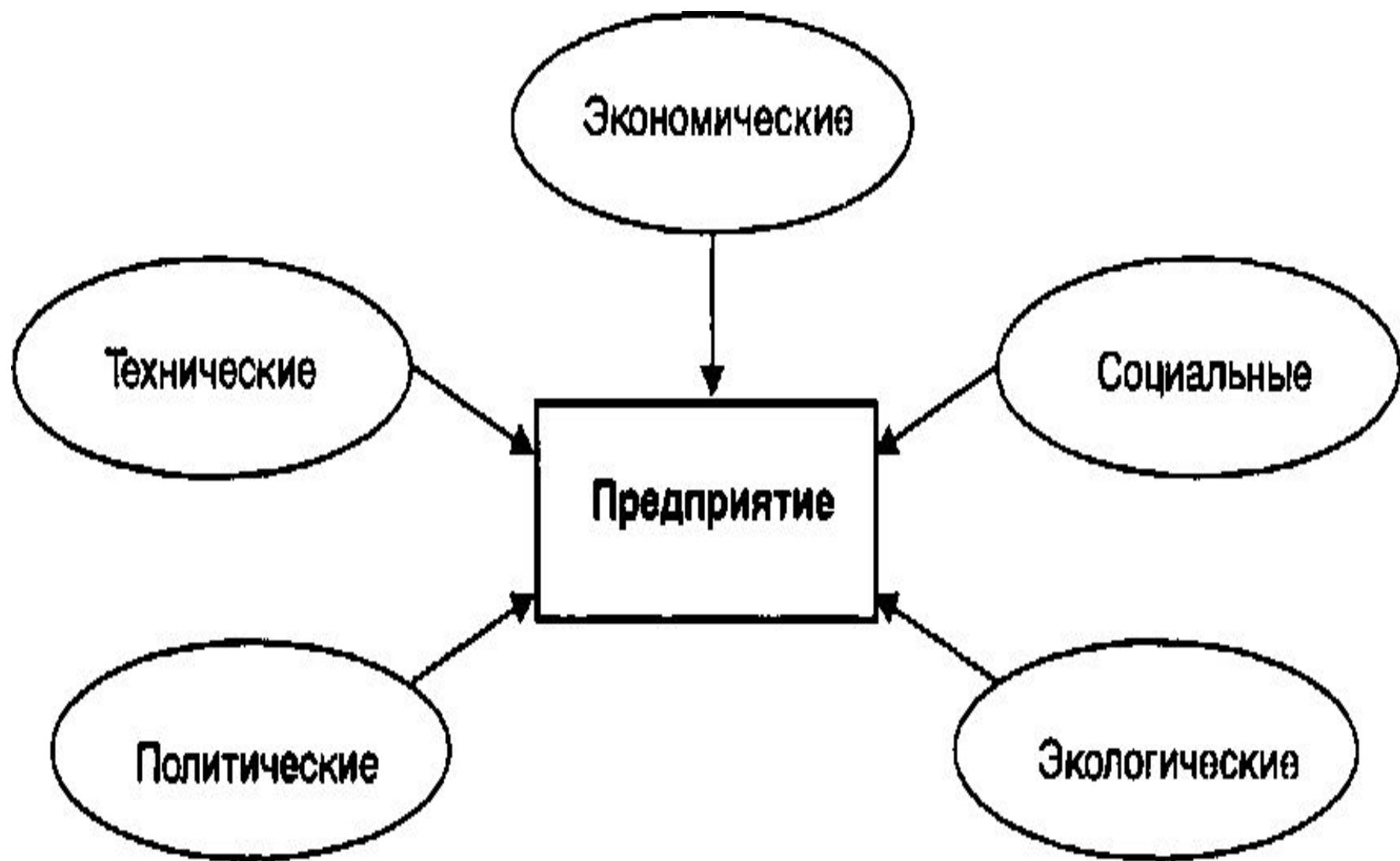
Рис. 3.3. Факторы косвенного действия на предприятие