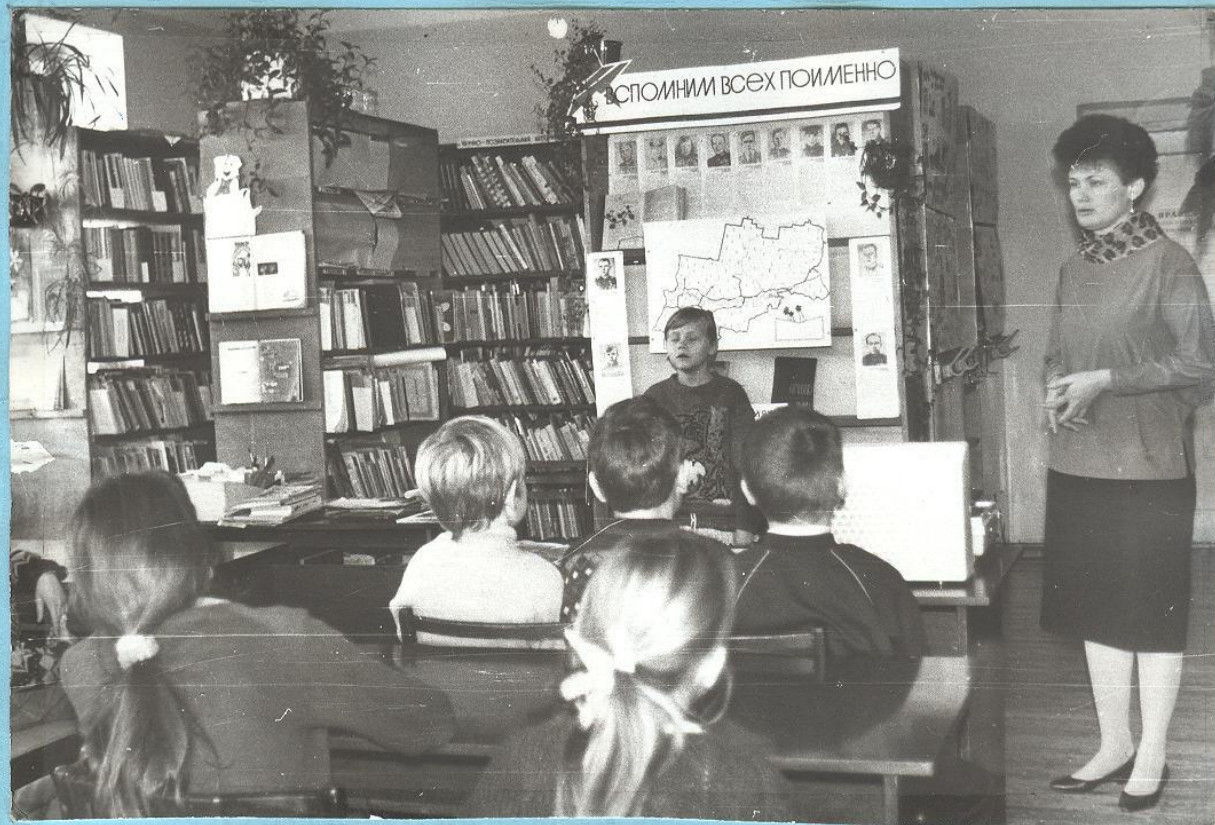
Пятиклассники на литературно-музыкальном часе, посвященном героям-пермякам. 1995 год.