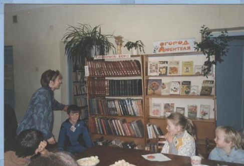
Семейный конкурс в разгаре!

Семейный клуб «Домовенок» совместными усилиями библиотечарей взрослой и детской библиотек создан уже несколько лет назад.