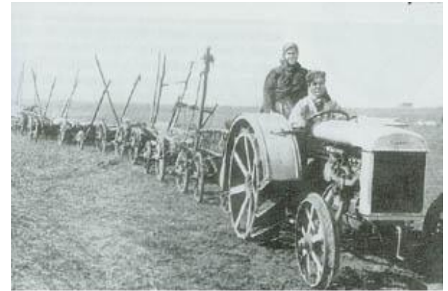
Новая техника на колхозных полях.