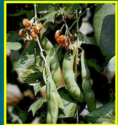
Фасоль огненная- декоративная вьющаяся форма