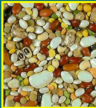
Семена фасоли разных сортов.