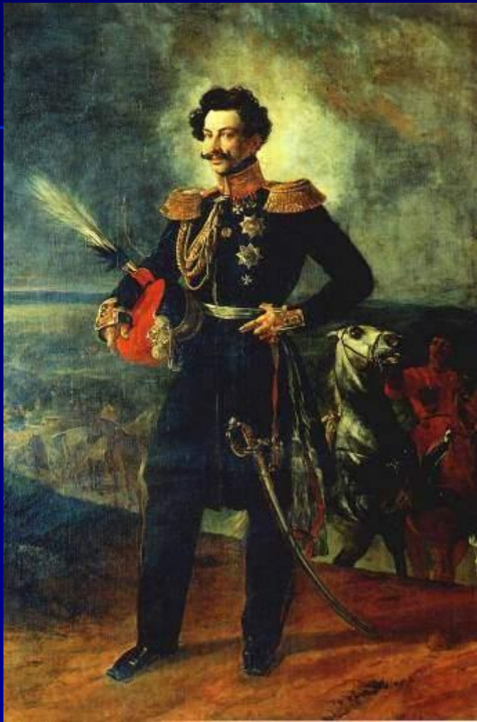
К.Брюллов. Граф В.А.Перовский

В 30-е гг. Россия установила протекторат над казахскими жузами , в этом районе началось строительство укреплений (крепости Копал и Верный).