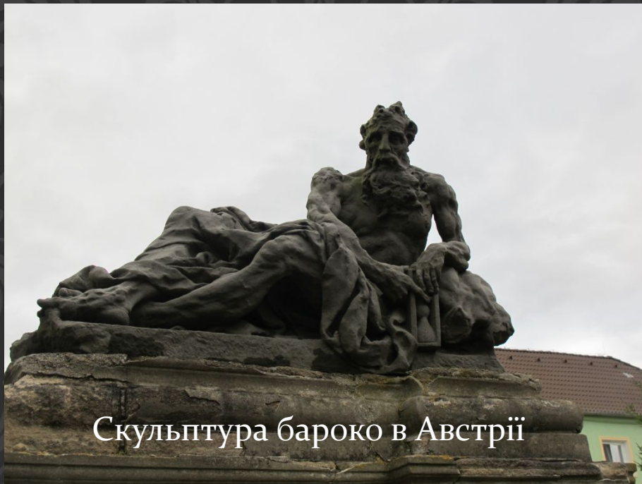
Скульптура бароко в Австрії