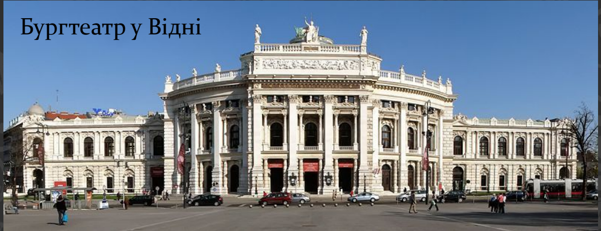
Бургтеатр у Відні

Культура Австрії дуже багата, країна внесла великий внесок у розвиток світової та європейської культури. Відень, довгий час був одним з головних культурних центрів Європи з багатою архітектурою і музичною культурою. Австрія подарувала світові багато відомих людей, таких як: Йоганн Штраус, Амадей Моцарт, Зигмунд Фрейд, Арнольд Шварценеггер.