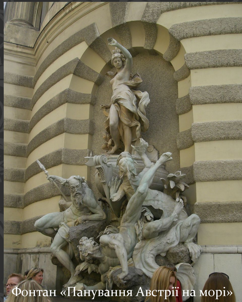
Фонтан «Панування Австрії на морі»