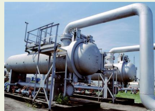
Газ, нефть и др.