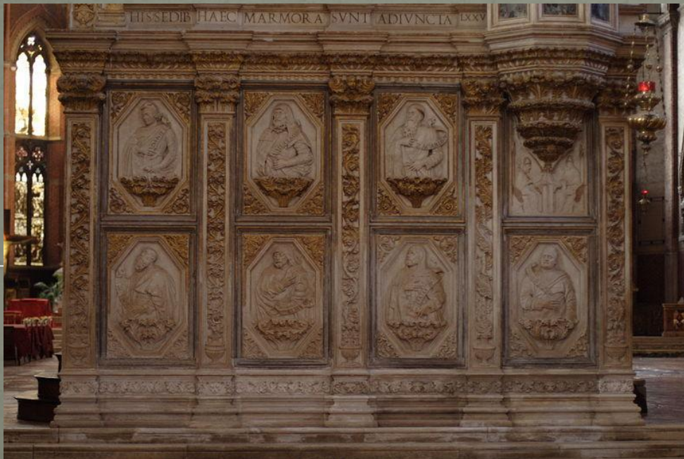
Барельефы стасидий базилики Фрари работы братьев Ломбардо

Туллио Ломбардо или Ломбарди (итал. Tullio Lombardo ; 1455, Венеция — 17.11.1532) — итальянский скульптор эпохи Возрождения. Сын скульптора и архитектора Пьетро Ломбардо, вместе с братом Антонио Ломбардо участвовал в создании большинства его скульптурных произведений.