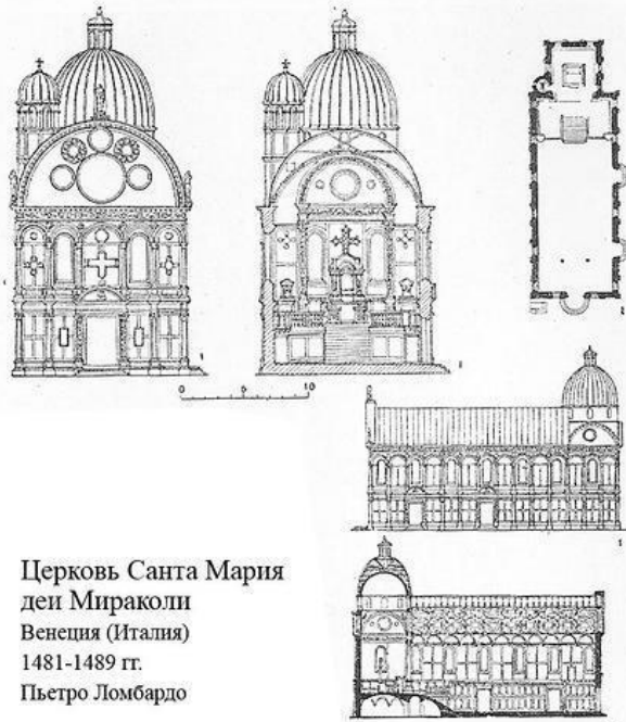
Церковь Санта Мария деи Мираколи Венеция (Италия) 1481-1489 гг. Пьетро Ломбардо