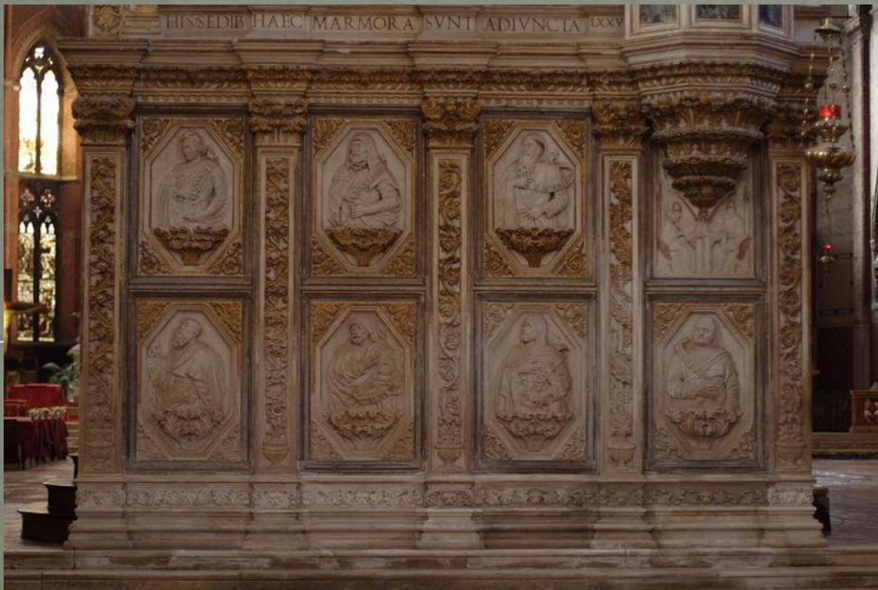
Барельефы стасидий базилики Фрари работы братьев Ломбардо

Туллио Ломбардо или Ломбарди (итал. Tullio Lombardo ; 1455, Венеция — 17.11.1532) — итальянский скульптор эпохи Возрождения. Сын скульптора и архитектора Пьетро Ломбардо, вместе с братом Антонио Ломбардо участвовал в создании большинства его скульптурных произведений.