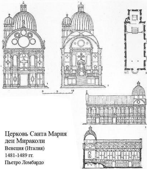
Церковь Санта Мария деи Мираколи Венеция (Италия) 1481-1489 гг. Пьетро Ломбардо