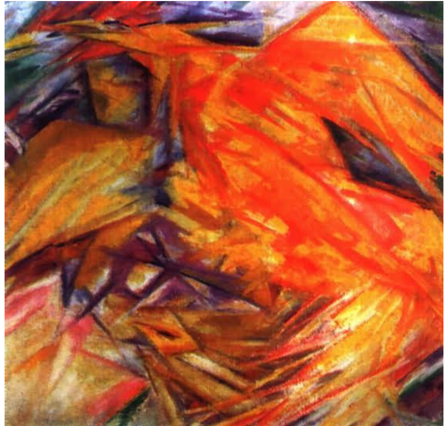
Лучистый петух, 1912 г.