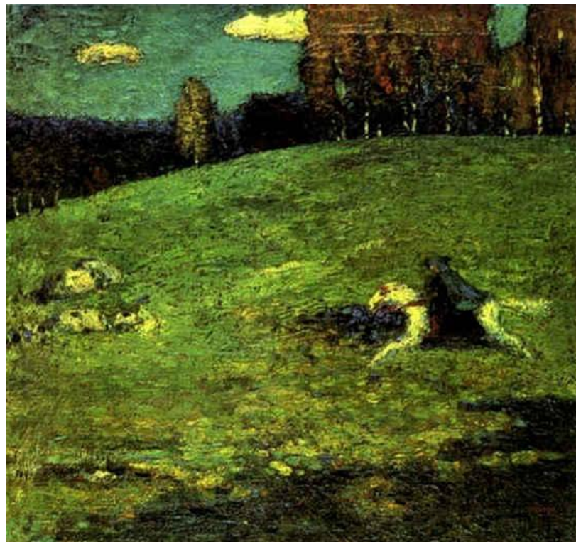
Синий всадник, 1903 г.

Родившийся в обеспеченной семье с богатыми культурными традициями, Кандинский получил великолепное образование — родители видели своего наследника блестящим юристом. Но в 30 лет он почувствовал, что должен искать себя в живописи и отправился в Германию. Изучая композицию и особенности живописи и графики, Кандинский не раз сталкивался с непониманием учителей, которые находили его цветовые решения слишком яркими, а компоновку картины излишне вольной.