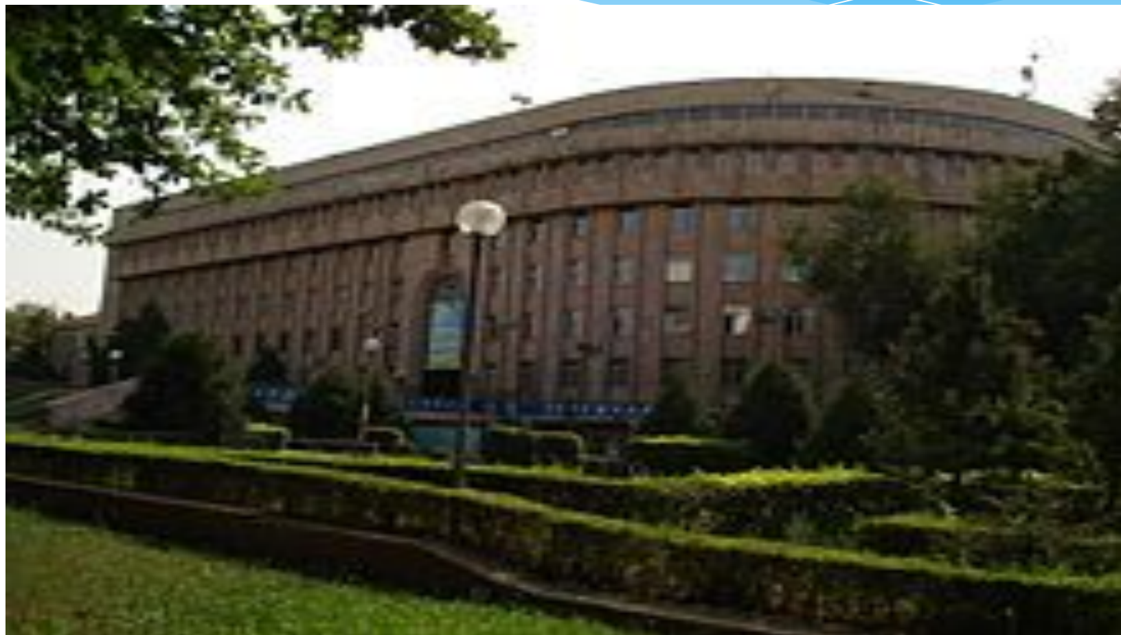
Главный корпус КазНПУ имени Абая