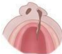
Cleft lip with partial palate involvement