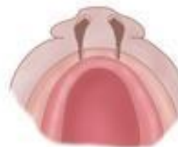
Bilateral cleft lip