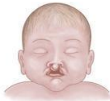
Bilateral cleft lip