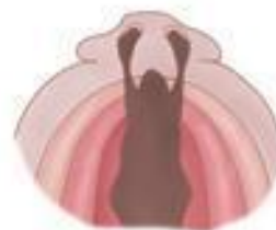
Bilateral cleft lip with full palate involvement