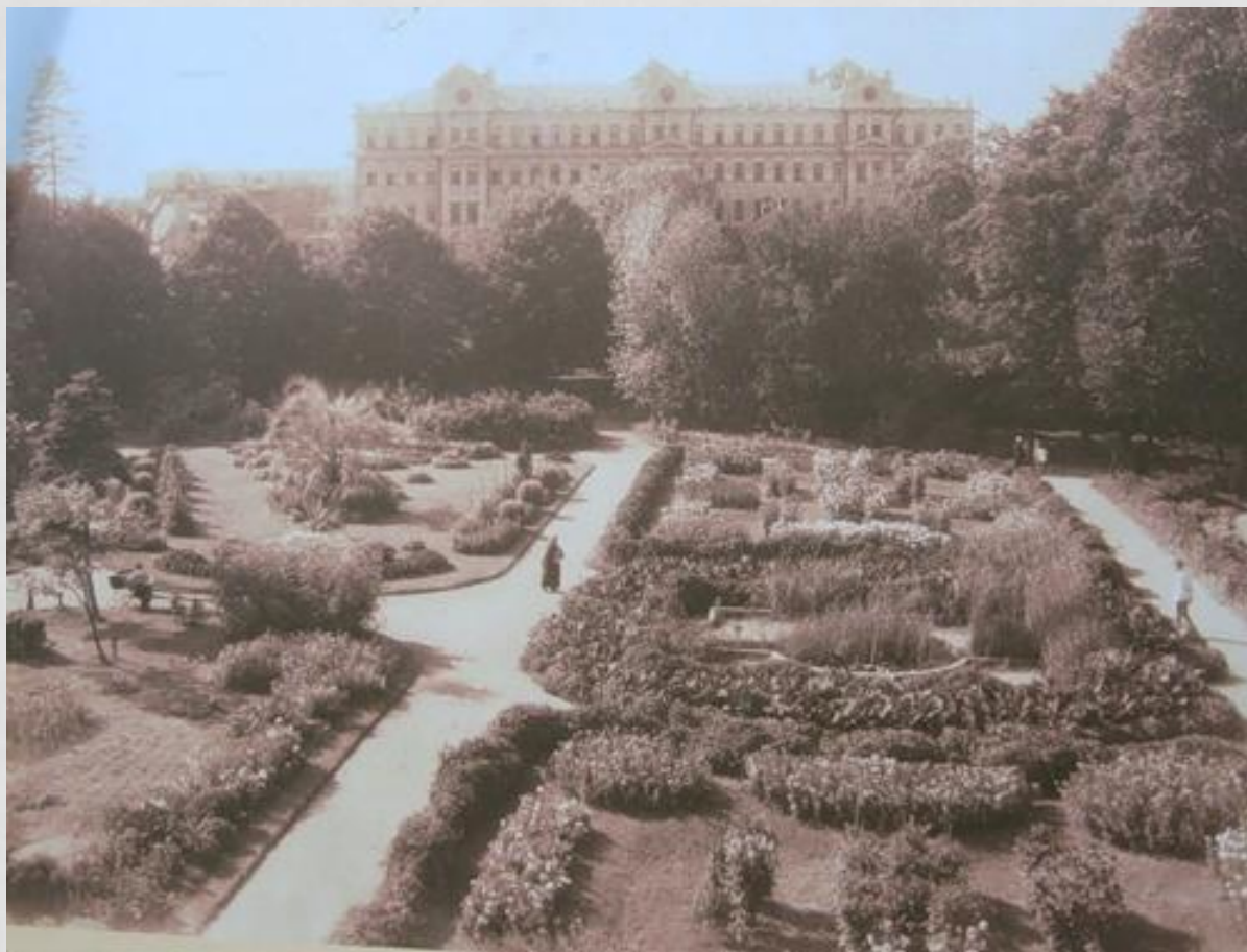
Ботанический сад МГУ. Аптека́рский о́город