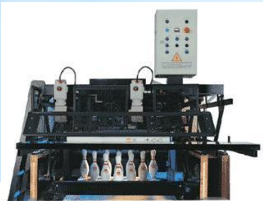
Пинспоттер VIA MC2