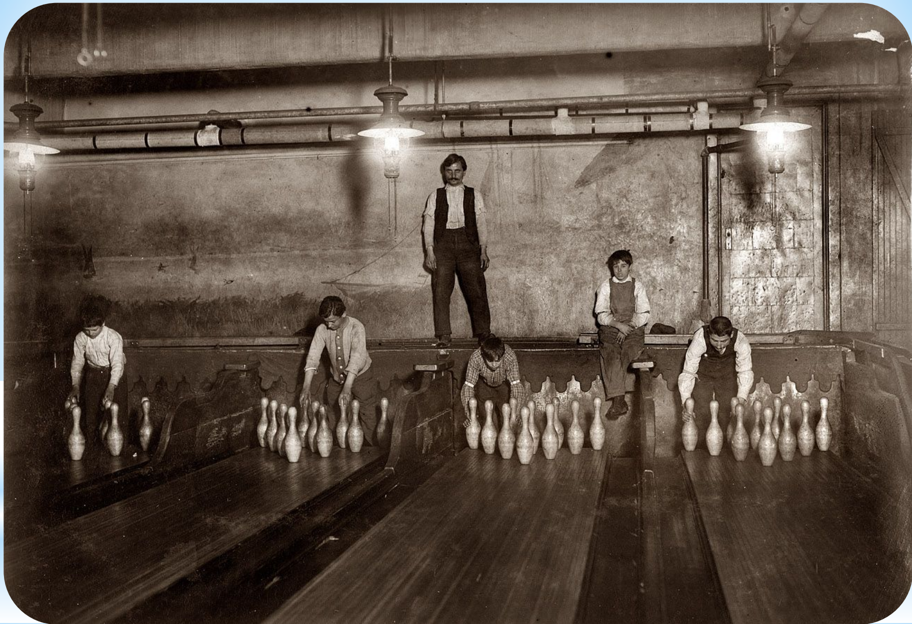
Пинбои и владелец боулинга. Начало 20 века.