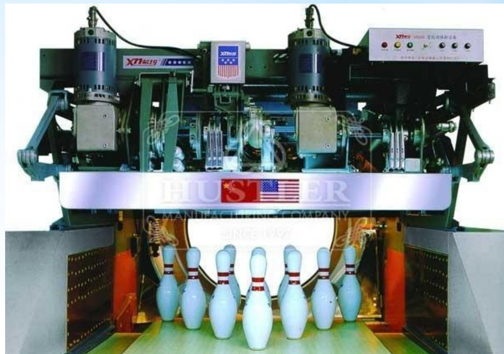
Пинспоттер фирмы GS