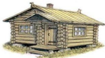
и . ба