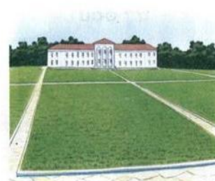
га . он