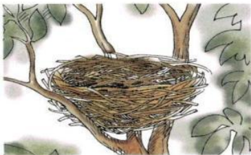
гне . до