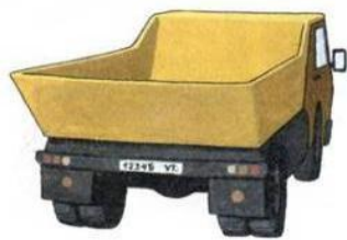
ку . ов