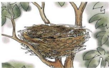
гне . до