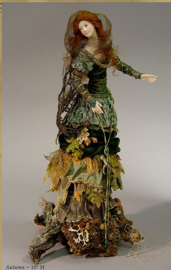
Autumn ~ 10" H