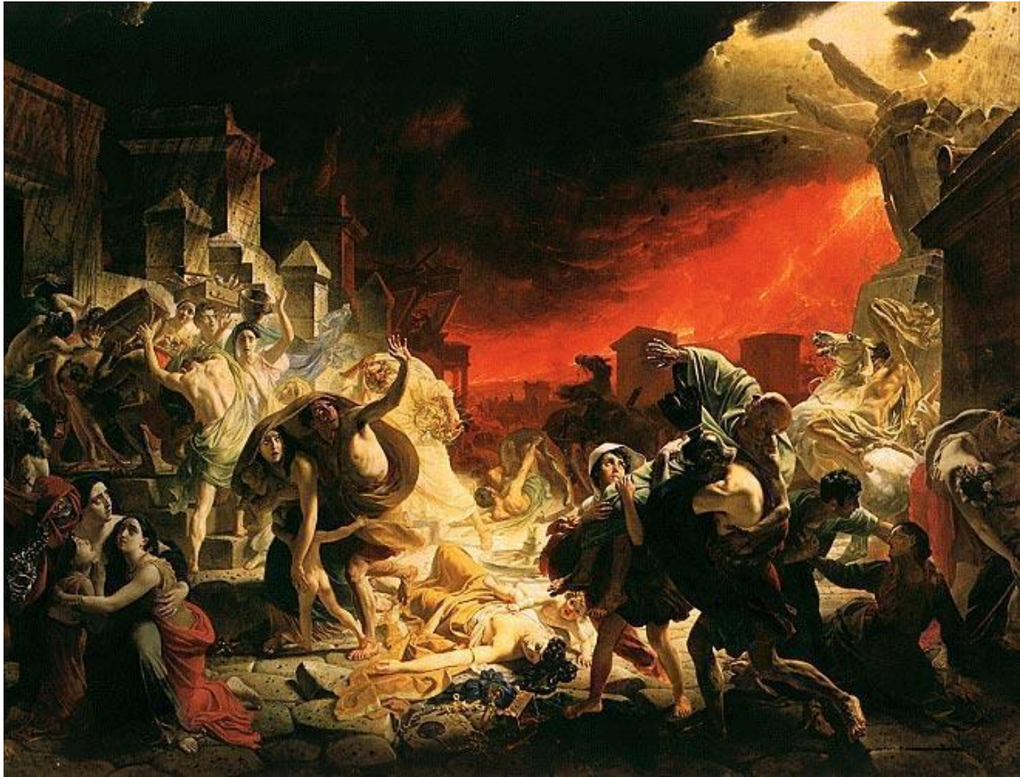
К. Брюллов. Последний день Помпеи

Искусство – это возможность интерпретировать реальные события