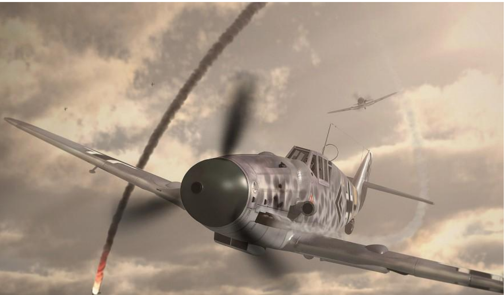
Messerschmitt Bf 109 G6