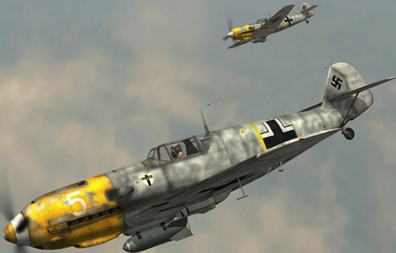
Немецкий самолет BF 109 E7-b на борту эмблема третьей группы 27-ой эскадры (III/JG27). E-7/b отличался от E-4/b способностью, кроме бомбы нести ПТБ.