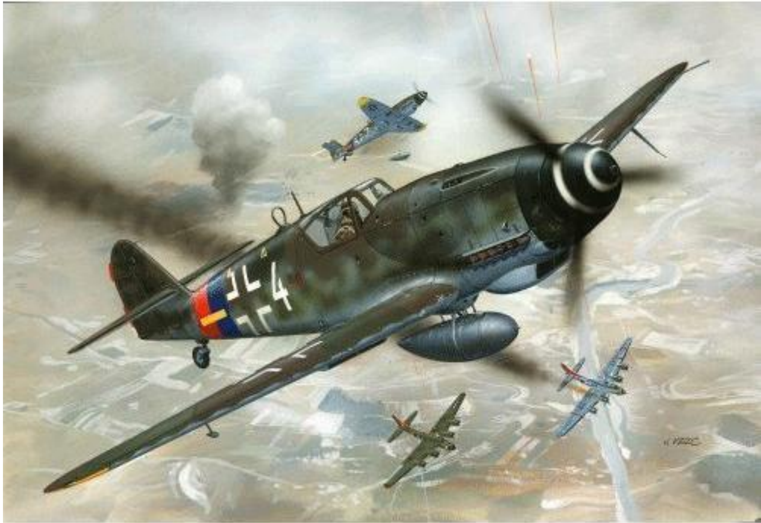
Messerschmitt Bf-109 (G-10)