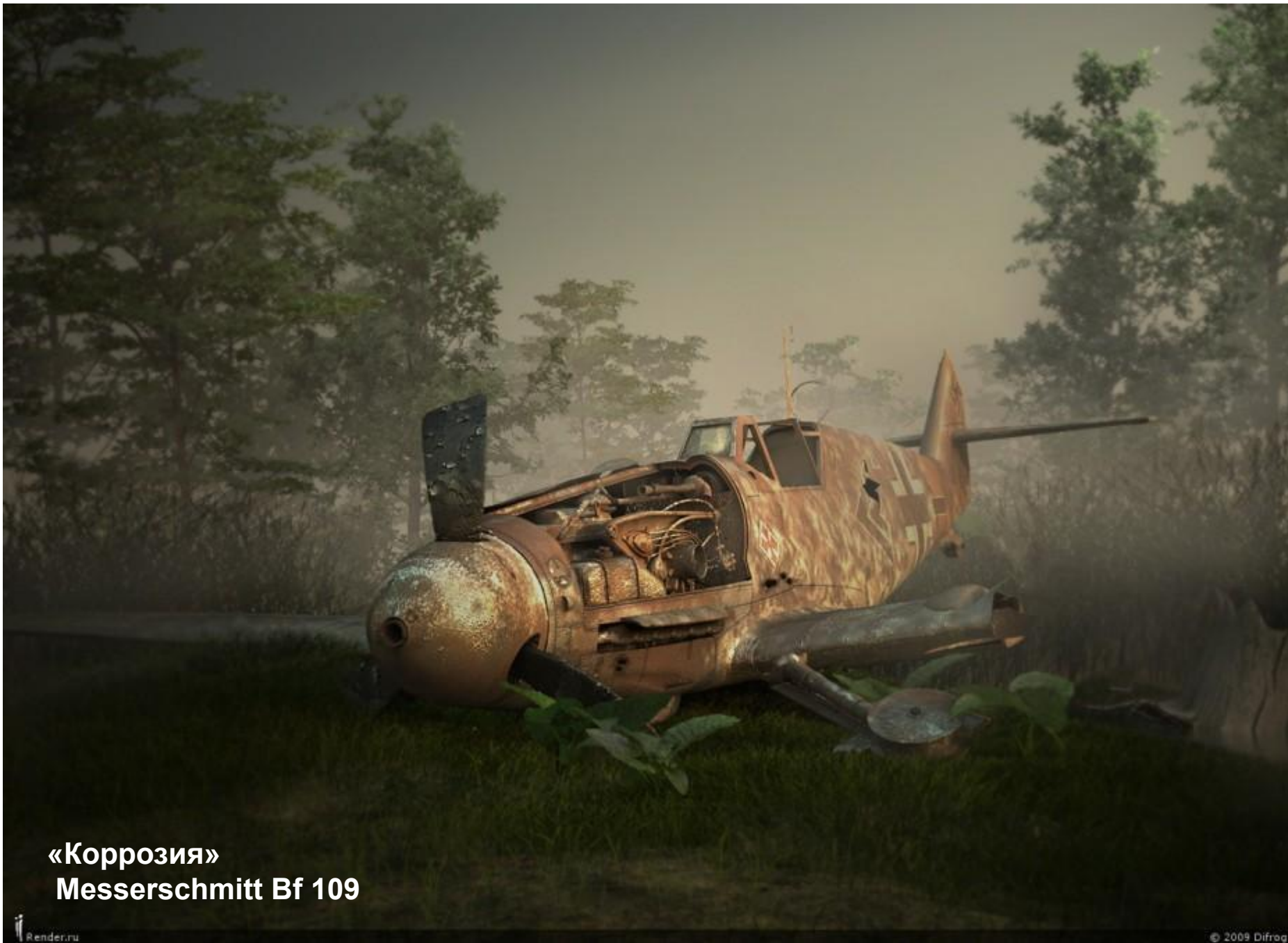
«Коррозия» Messerschmitt Bf 109