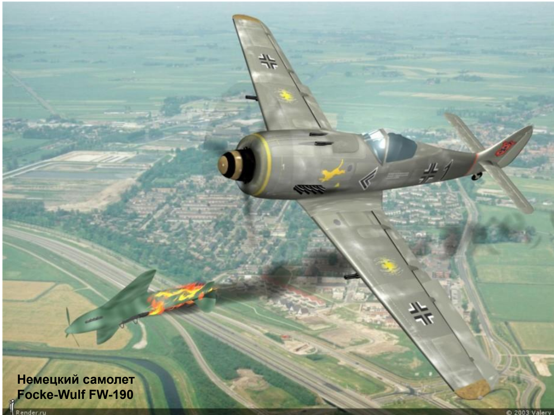
Немецкий самолет Focke-Wulf FW-190