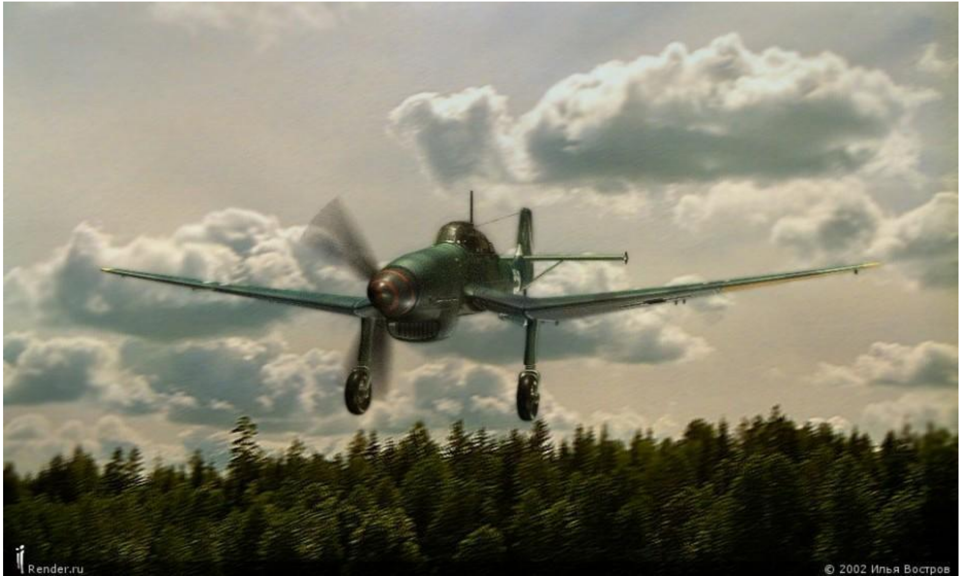
Langing Junkers-87 Stuka