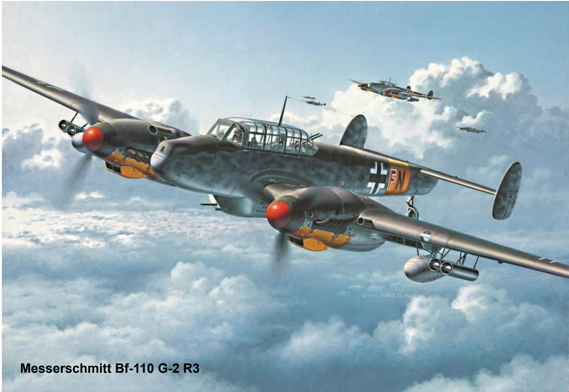
Messerschmitt Bf-110 G-2 R3