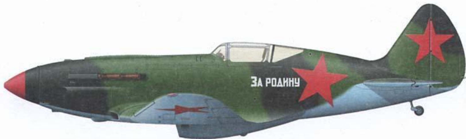
МиГ-3 из состава 122-го ИАП, на котором совершал боевые вылеты лейтенант В.Рыбалко, весна-лето 1942 г.