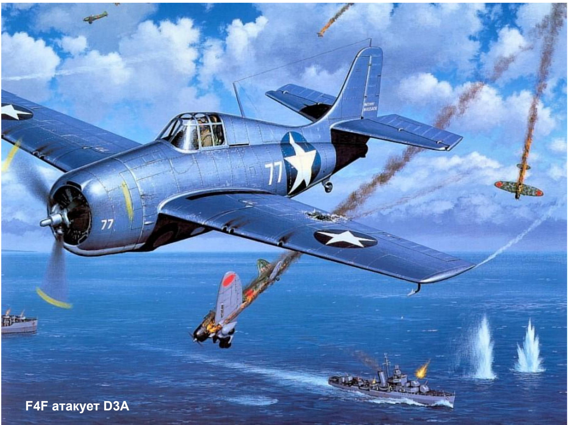
F4F атакует D3A