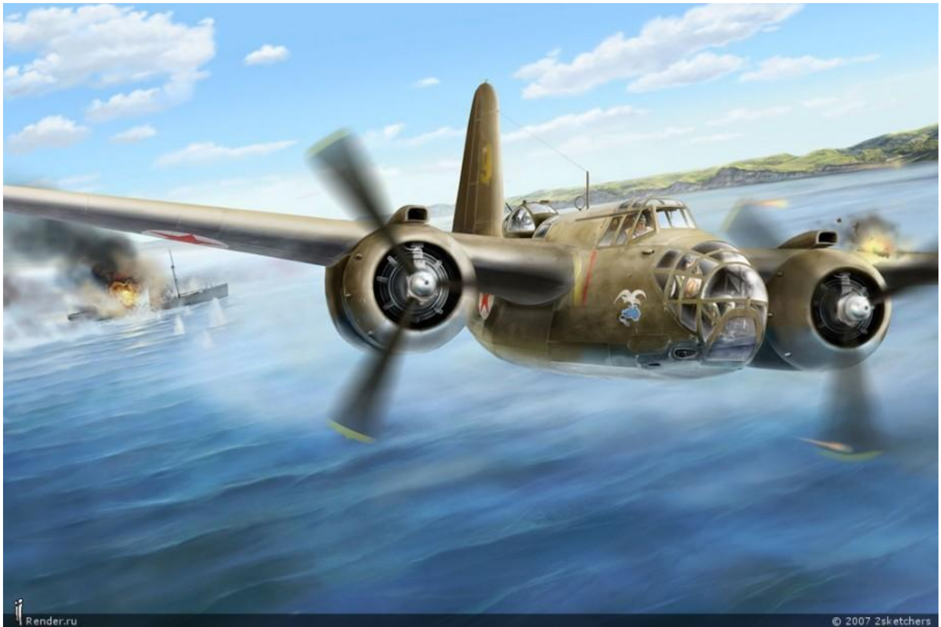
Атака Бостона... Douglas A-20 Havoc/DB-7 Boston