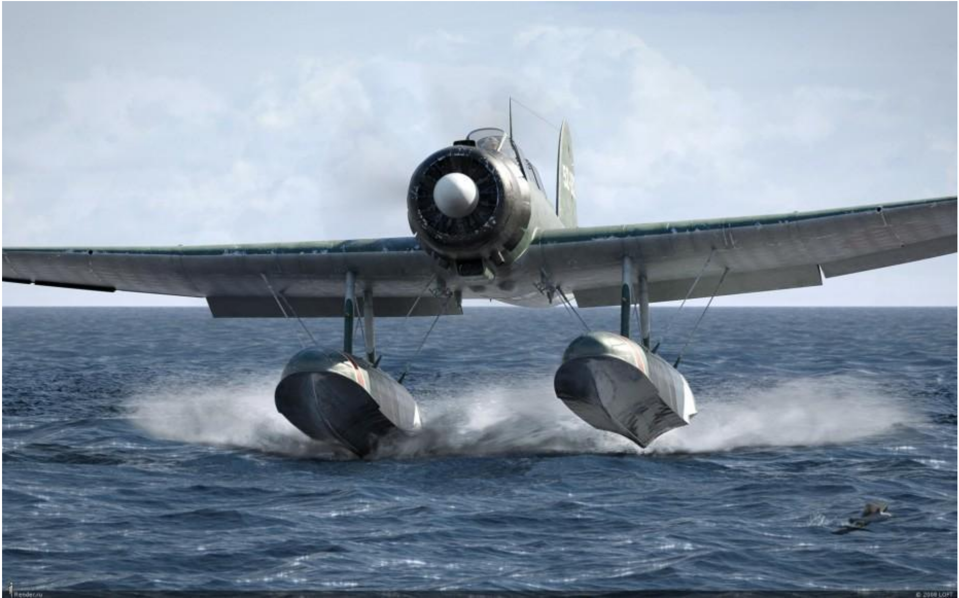
Aichi E13A Jake