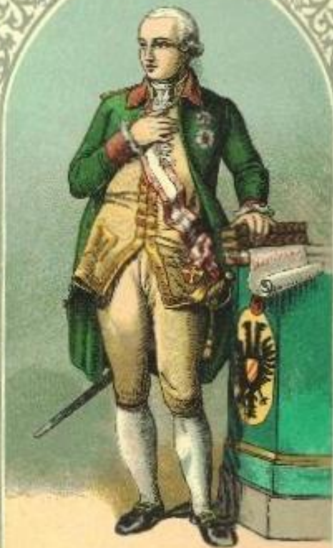
Joseph der Zweite. 1765—1790.

Старший сын Марии-Терезии, самостоятельно править начал со смерти матери в 1780 г. Выдающийся государственный деятель, реформатор, яркий представитель эпохи просвещённого абсолютизма.