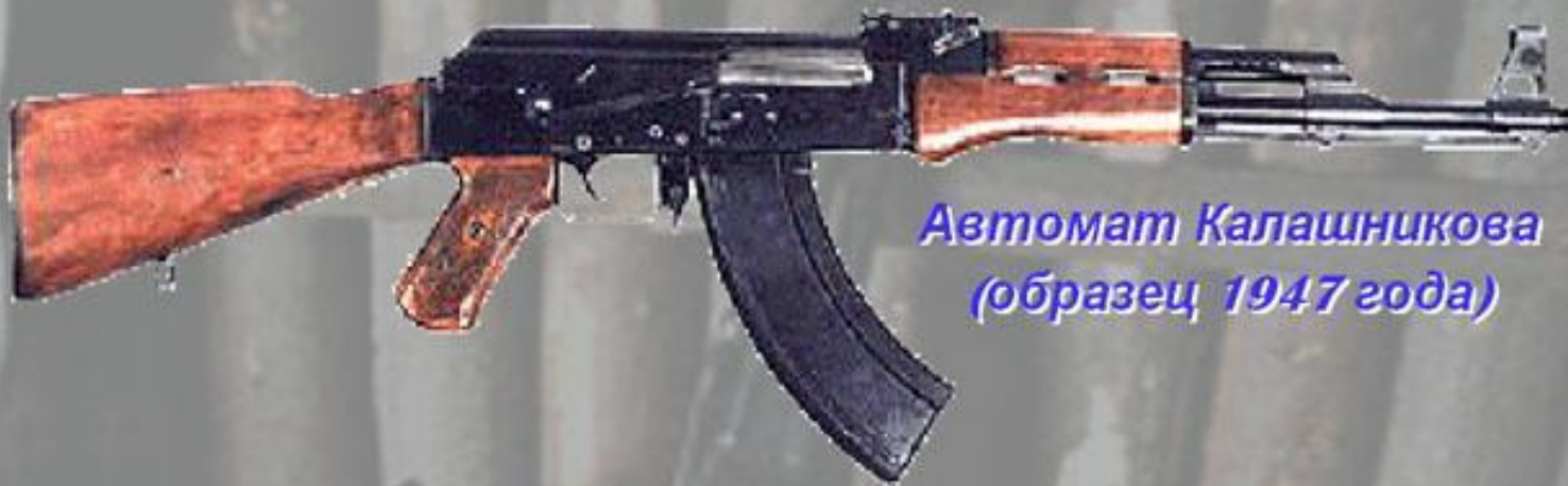
Автомат Калашникова (образец 1947 года)