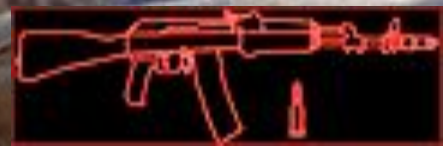
Огонь по пехоте противника