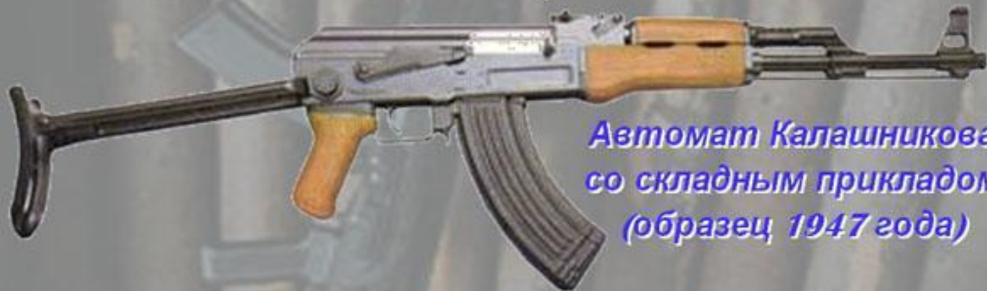
Автомат Калашникова со складным прикладом (образец 1947 года)