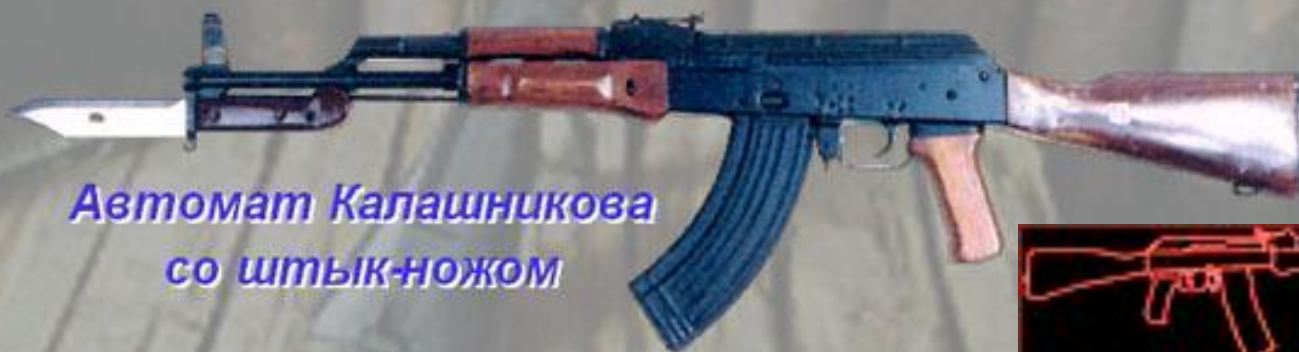
Автомат Калашникова со штык-ножом