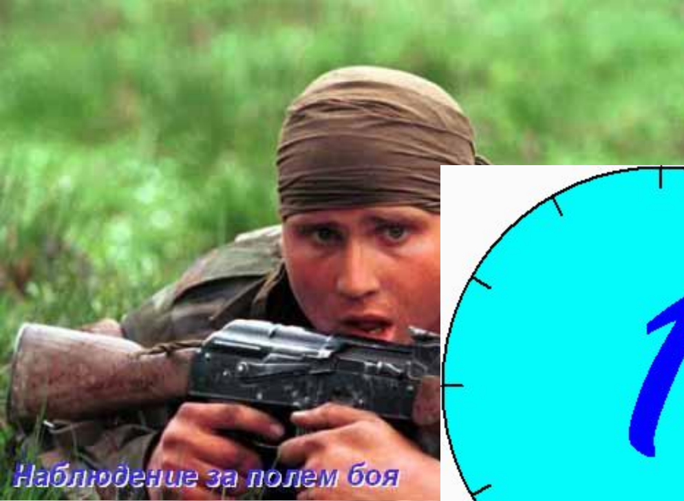
Наблюдение за полем боя