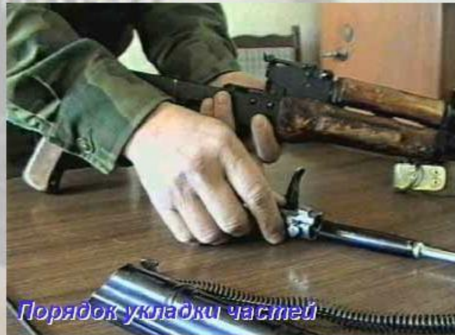
Порядок укладки частей