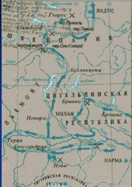
ИТАЛЬЯНСКИЙ И ШВЕЙЦАРСКИЙ ПОХОДЫ РУССКОЙ АРМИИ в 1799 г. Масштаб 1:4 000 000