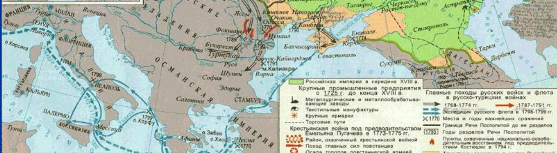
Масштаб 1:17 500 000 (в 1 см 175 км)