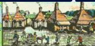
Медеплавильный завод на Урале