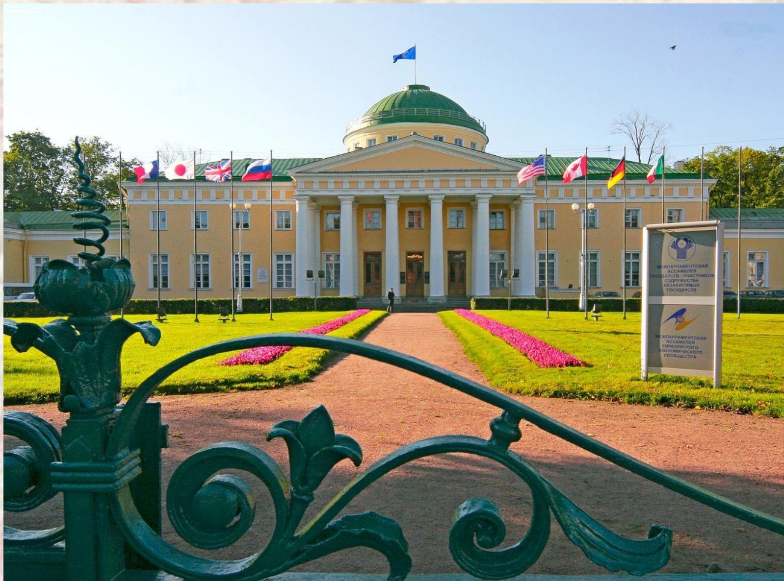
Таврический дворец сегодня