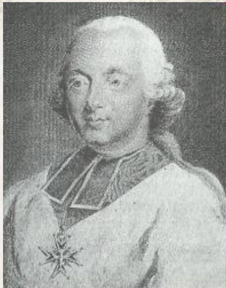
Графиня де Ламотт и кардинал де Роган