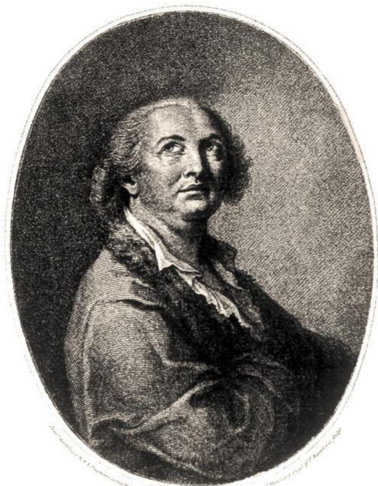
COMTE de CAGLIOSTRO.