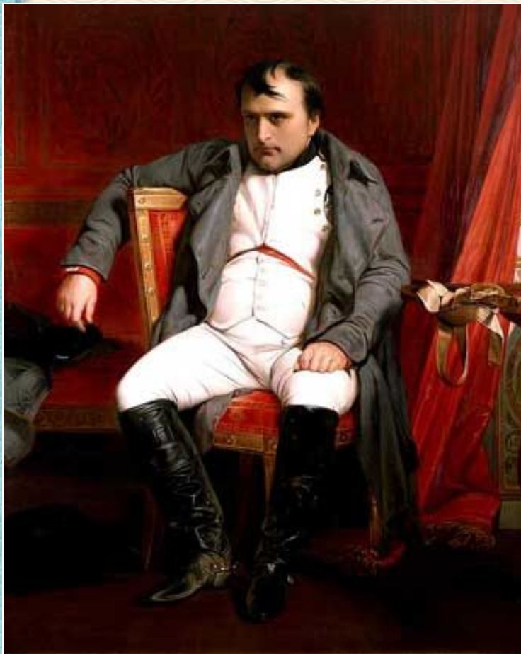
Волк – Наполеон