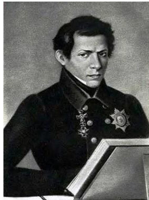
Николай Иванович Лобачевский