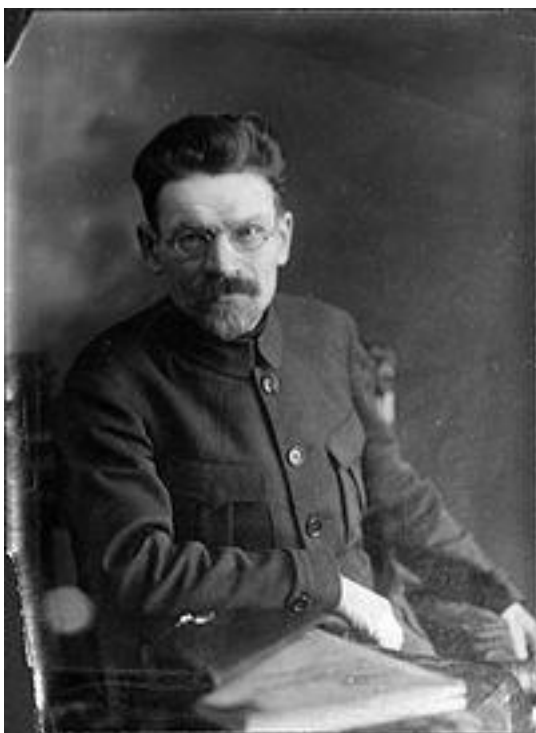
Михаил Иванович Калинин