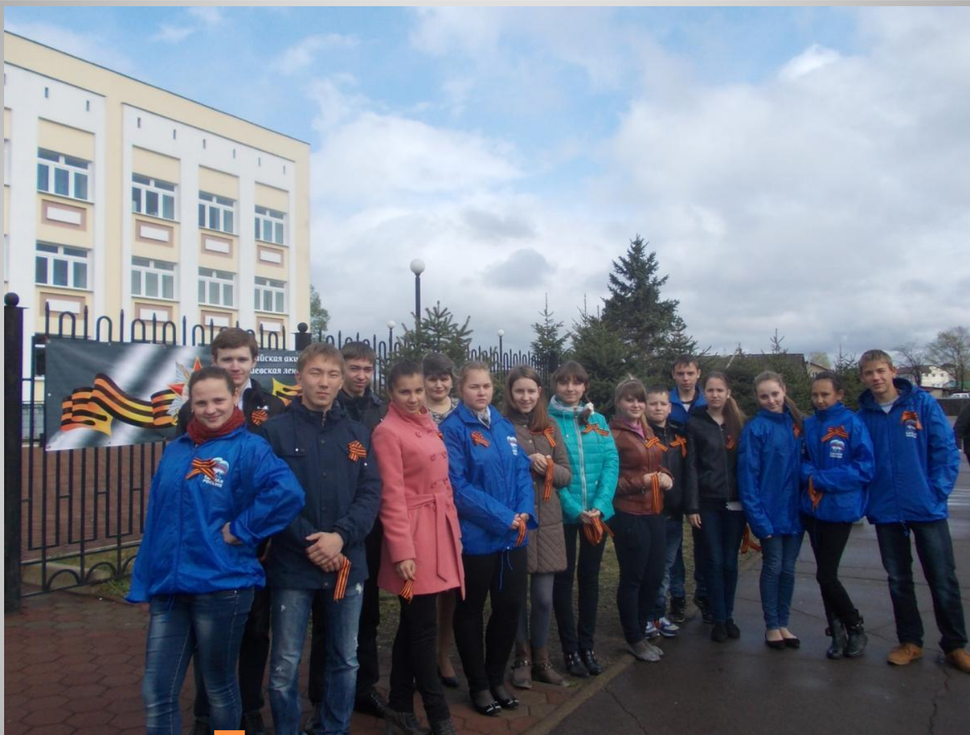
Акция «Георгиевская ленточка» 2014 год